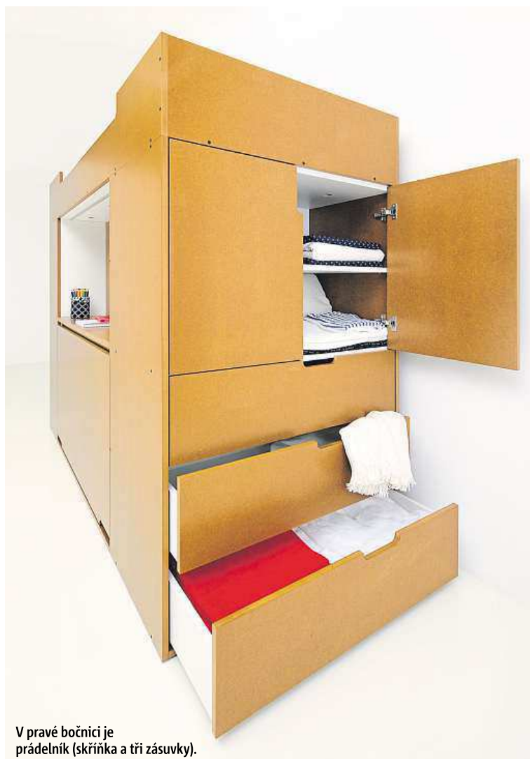
V pravé bočnici je prádelník (skříňka a tři zásuvky).