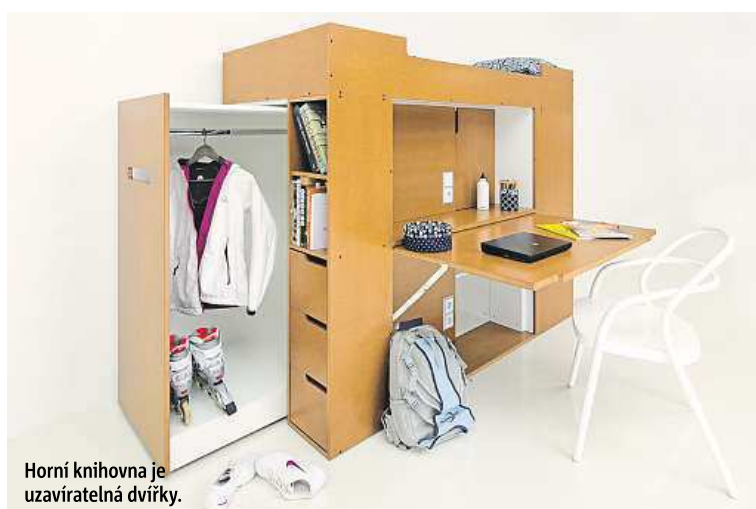
Horní knihovna je uzavíratelná dvířky.