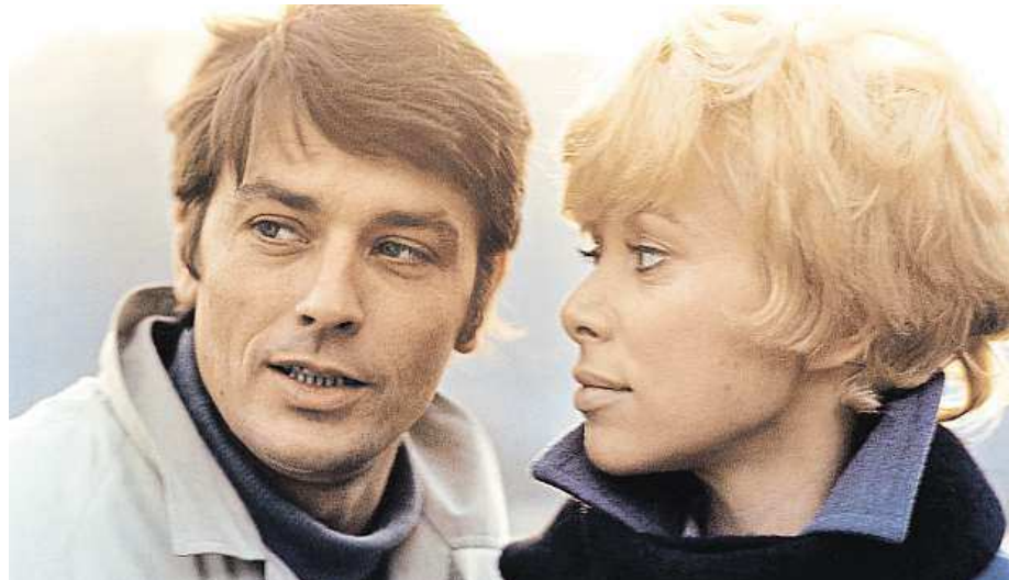
Delon se s Darcovou sešel v roce 1968 ve filmu Jeff.