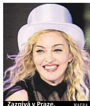
Zazpívá v Praze.