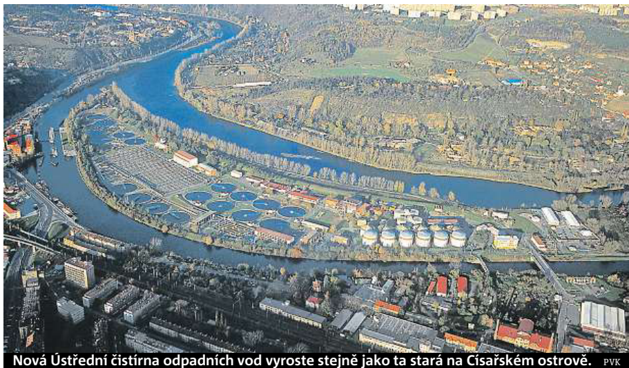
Nová Ústřední čistírna odpadních vod vyroste stejně jako ta stará na Císařském ostrově. PVK

A to je jen začátek potřebné investice. Nová vodní linka bude totiž stát kolem šesti miliard korun. Nyní Praha hledá způsob, jak bude stavbu v pří-