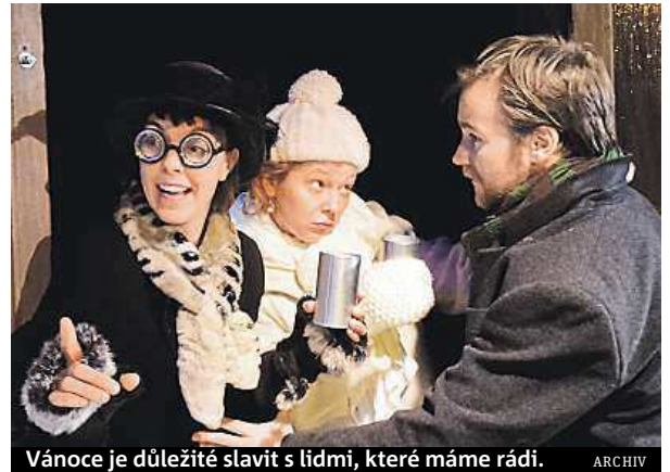
Vánoce je důležité slavit s lidmi, které máme rádi.

Je to sice naše první spolupráce, ale známe se delší