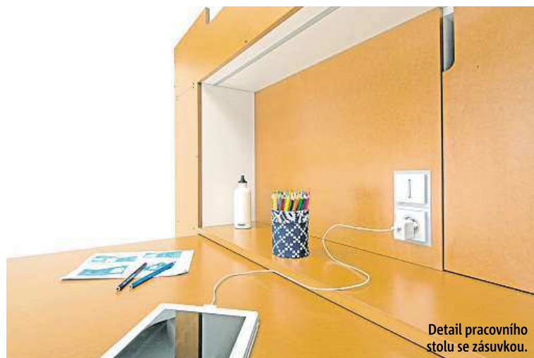
Detail pracovního stolu se zásuvkou.