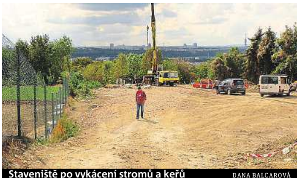
Staveniště po vykácení stromů a keřů

Podle zastupitelky devítky a členky občanského sdružení Krocan Dany Balcarové se však kácelo v rozporu se zákonem. „Městská část nechala vykácet veškerou zeleň na daném pozemku, aniž by tomu předcházelo řízení o povolení kácení dřevin,“ stěžuje si na praktiky radnice Balcaro-