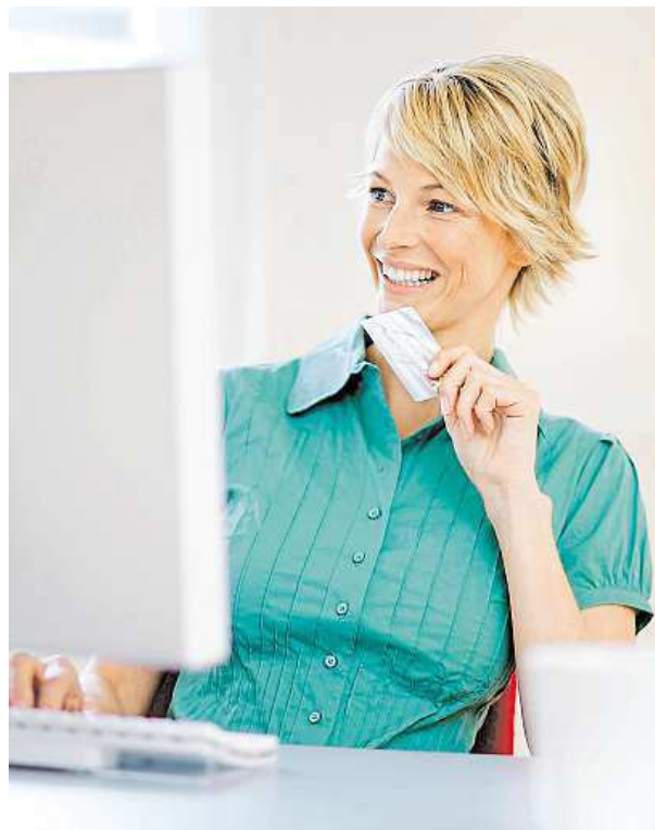
Na českém trhu funguje skoro 37 tisíc e-shopů.

8) Vyplatí se také zjistit, zda je firma zapsána v obchodním rejstříku. Na adrese www.obchodnirejstrik.cz stačí zadat název e-shopu nebo jeho provozovatele. Pokud tam nic o hledané firmě nenajdete, je to natolik podezřelé, že bude lépe kliknout jinak.