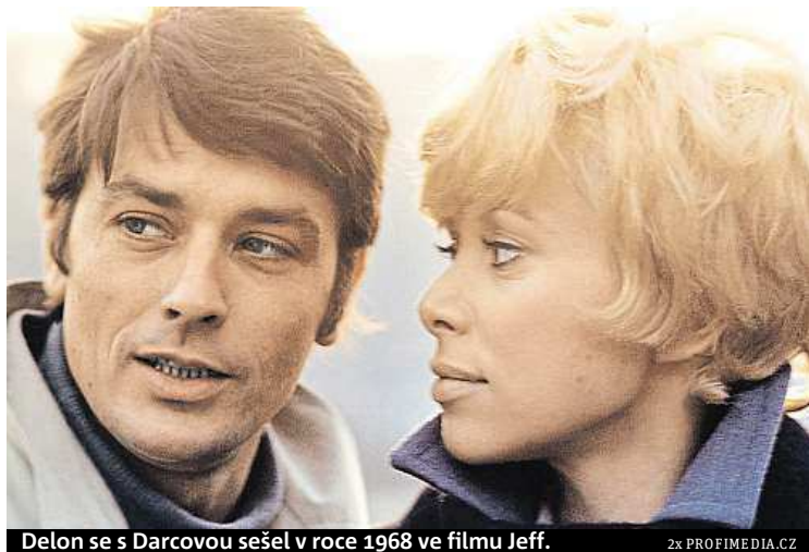
Delon se s Darcovou sešel v roce 1968 ve filmu Jeff.

Alain Delon, který slaví v neděli osmdesátiny, se rozněžnil.