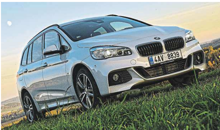
Tradicionalisté pláčou, ale co. I sedmimístný bavorák může vypadat svěže!

Gran Tourer jde přitom ještě dál. Je to prémiová alternativa velkých rodinných aut, třebaže se s ní nový Volkswagen Touran v nejvyšší výbavě nebo nabušený Ford S-Max mohou čile měřit. Uvnitř však máte pořád pocit, že sedíte ve drahém bavoráku: je to cítit z materiálů přístrojové desky i potahů sedadel, designové svítící linky spojující zevnitř oboje dveře nebo přístrojové štíty.