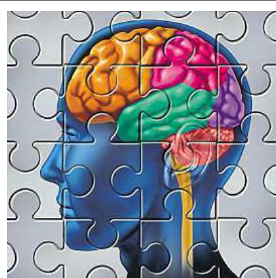
Jak poznáme Alzheimerovu chorobu?

Nemoc začíná pozvolna. Nejříve se u nemocného zhoršuje krátkodobá paměť a není schopen se postarat o některé věci v domácnosti.