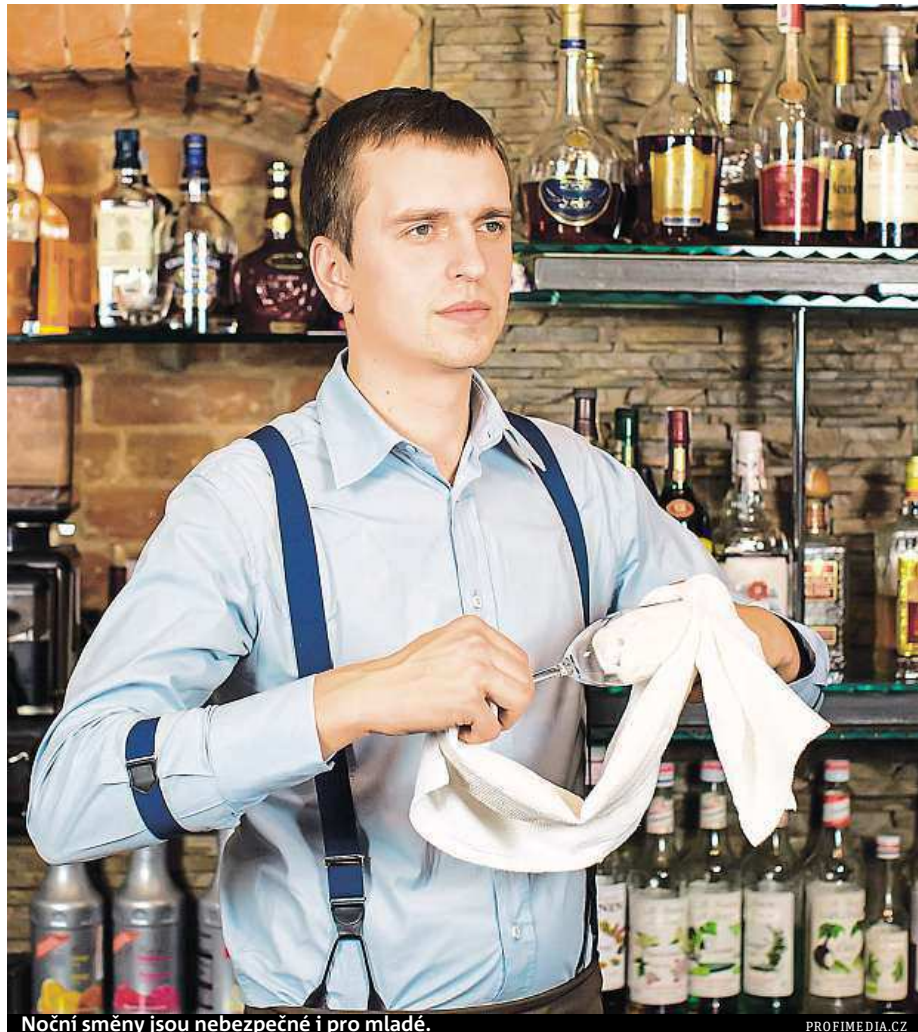
Noční směny jsou nebezpečné i pro mladé.