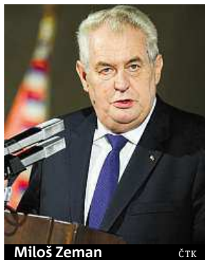
Miloš Zeman

Zeman doslova vytkl, že podle něj „zkur..la“ služební zákon.