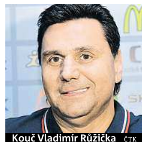
Kouč Vladimír Růžička

v nácvičku herních situací z letních kempů. „Chceme si vše oživit. Rozhodli jsme se, že dáme šanci mladíkům, a teď nás čeká první test, který ukáže, jak na tom český hokej je,“ doplnil Růžičkův asistent Jaroslav Špaček.