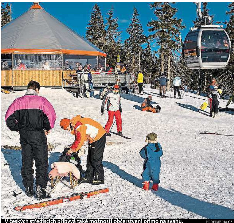
V českých střediscích přibývá také možnost občerstvení přímo na svahu.

Věcí, která zajímá mnoho lyžařů, je cena skipasů. Ta ve zhruba polovině větších středisek zůstává stejná jako v minulé sezoně. „Některé skiareály nabídnou celodenní skipasy dokonce levněji,“ podotýká výkonný ředitel Asociace horských středisek Libor Knot. Takových areálů