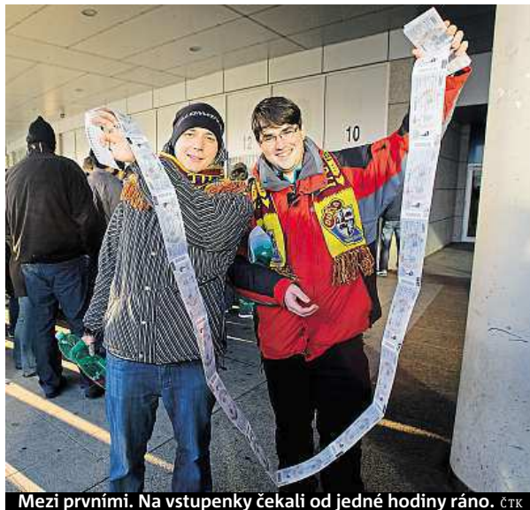
Mezi prvními. Na vstupenky čekali od jedné hodiny ráno.