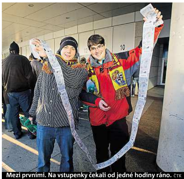
Mezi prvními. Na vstupenky čekali od jedné hodiny ráno.