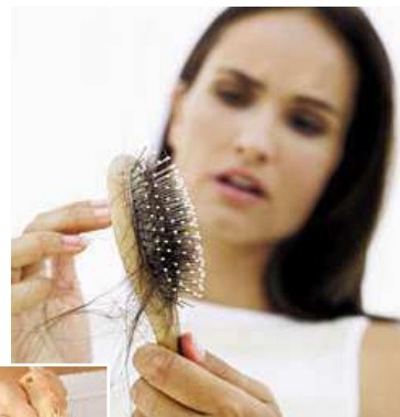
Důkaz: žádné vlasy v kartáči navíc

K zesílení účinku používejte fyto-kofeinové tonikum, které aplikujte přímo na ohrožená místa vlasové pokožky. Kofein se tak velmi rychle vstřebá a vytvoří zásobu na 24 hodin.