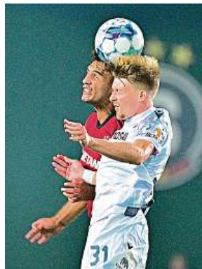
Sparta nastoupila v lize proti Plzni, nyní je čekají poháry. ČTK

Obhájci českého titulu půjdou do souboje s Betisem v dobrém rozpoložení. Letenští v sobotu v lize porazili Plzeň 2:1 a nenašli přemožitele osm soutěžních duelů po sobě, z nichž sedm vyhráli. Domácí ligu vedou o dva body.