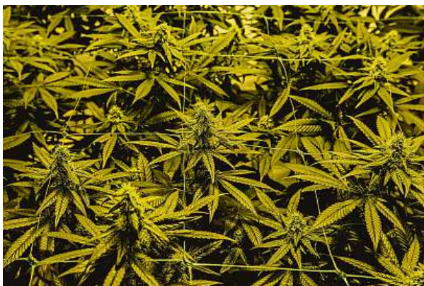
CBD produkty jsou považovány za přírodní alternativu pro sebebepěči a normální zdravotní stav. MAFRA

Momentálně se však CBD stále porovnává a řeší v souvislosti s kratomem a HHC, na rozdíl od nich však nemá žádné negativní účinky. „Ve hře je návrh novely zákona o omamných látkách zvaných psychomodulační látky. Ten