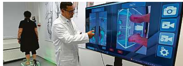
Vyšetření v nové laboratoři diagnostiky a pohybového aparátu ČTK

Posuzování pohybového aparátu a chodidel přinese