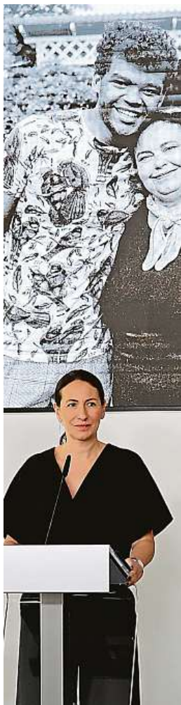
Praha pěstounskou péči podporuje dlouhodobě.

Pěstoun nemusí být žádný superman. Je ale určitě zapotřebí, aby prošel takzvaným přípravným kurzem a psychotesty. Posuzují se i další faktory, jako je motivace, zázemí, zdravotní stav a tak dále. Důležitá je ale především ochota pěstouna přijmout dítě, které to skutečně potřebuje. Dítě, které má za sebou mnohdy těžkou minulost, jež ovlivňuje nejen současnost, ale často i jeho budoucnost. Zároveň je u pěstounů důležitá ochota a umění jednat s biologickou rodinou, protože kontakt s ní je často nedílnou součástí výkonu pěstounské péče.