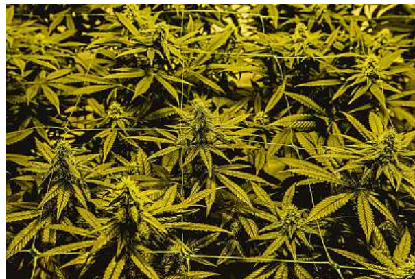
CBD produkty jsou považovány za přírodní alternativu pro sebezpečí a normální zdravotní stav.