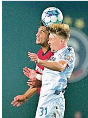
Sparta nastoupila v lize proti Plzni, nyní je čekají poháry.

Obhájci českého titulu půjdou do souboje s Betisem v dobrém rozpoložení. Letenští v sobotu v lize porazili Plzeň 2:1 a nenašli přemožitele osm soutěžních duelů po sobě, z nichž sedm vyhráli. Domácí ligu vedou o dva body.