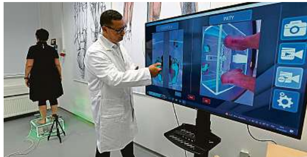
Výšetření v nové laboratoři diagnostiky a pohybového aparátu

Odborníci udělají zájemcům v laboratoři podrobný rozbor chodidel a zhodnotí je ve statické i dynamické zátěži. Posoudí také další vliv na postavení celého těla. „Po-