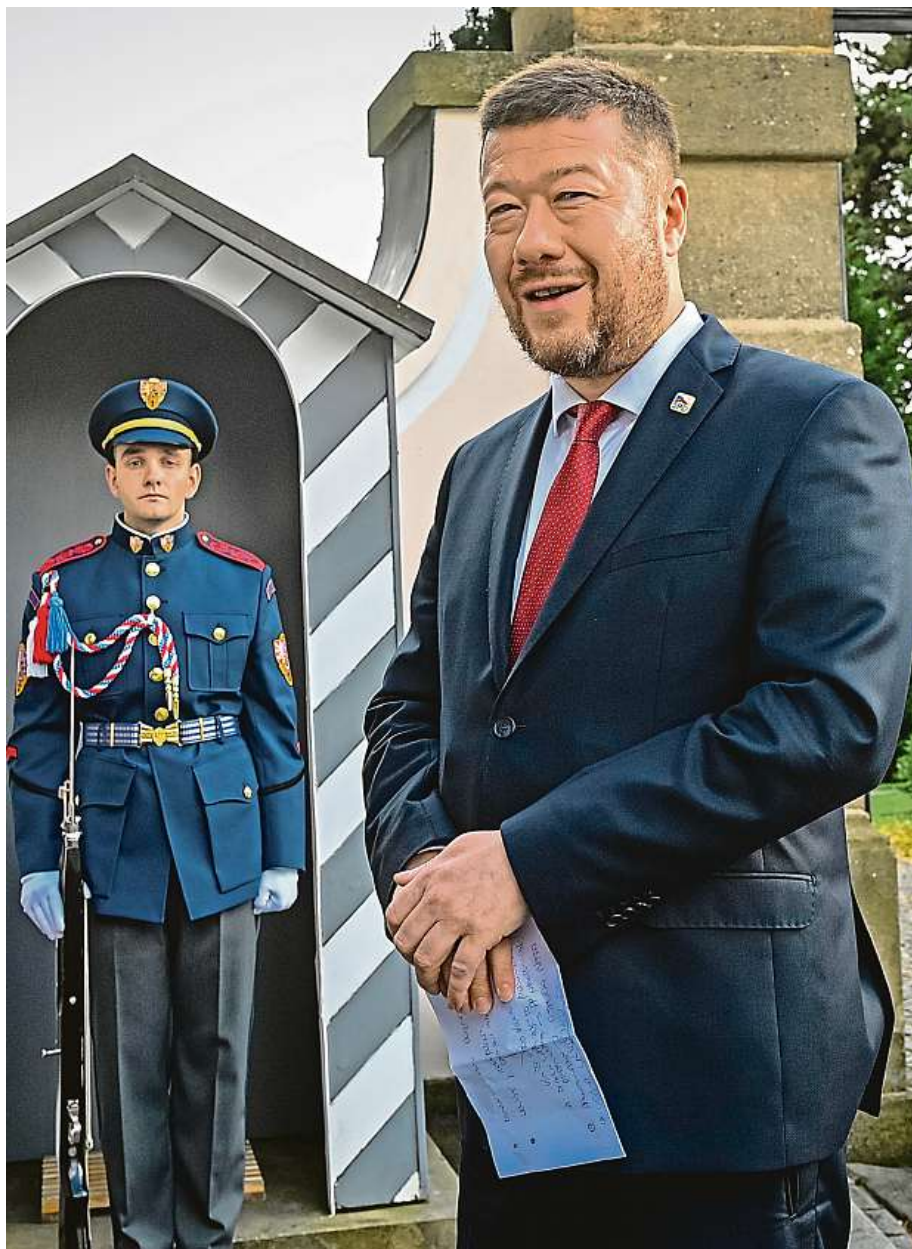
Tomio Okamura prožil poslední čtyři roky jako místopředseda Poslanecké sněmovny.

Ano, psal. Například v dětství, když jsem chodil do Skauta.