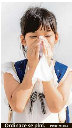
Ordinace se plní.

A situace se podle něj bude postupem času horšit, protože se ochladí. Při nízkých teplotách se viry rychleji množí a hrozí tak vyšší riziko nákazy. Navíc budou děti přecházet z chladna do přetopených místností škol a školek, kde je často suchý vzduch. Vlivem toho vysychají sliznice, které tak méně účinně plní svou obrannou funkci, takže viry snadněji vniknou do těla. Navíc se v takovýchto