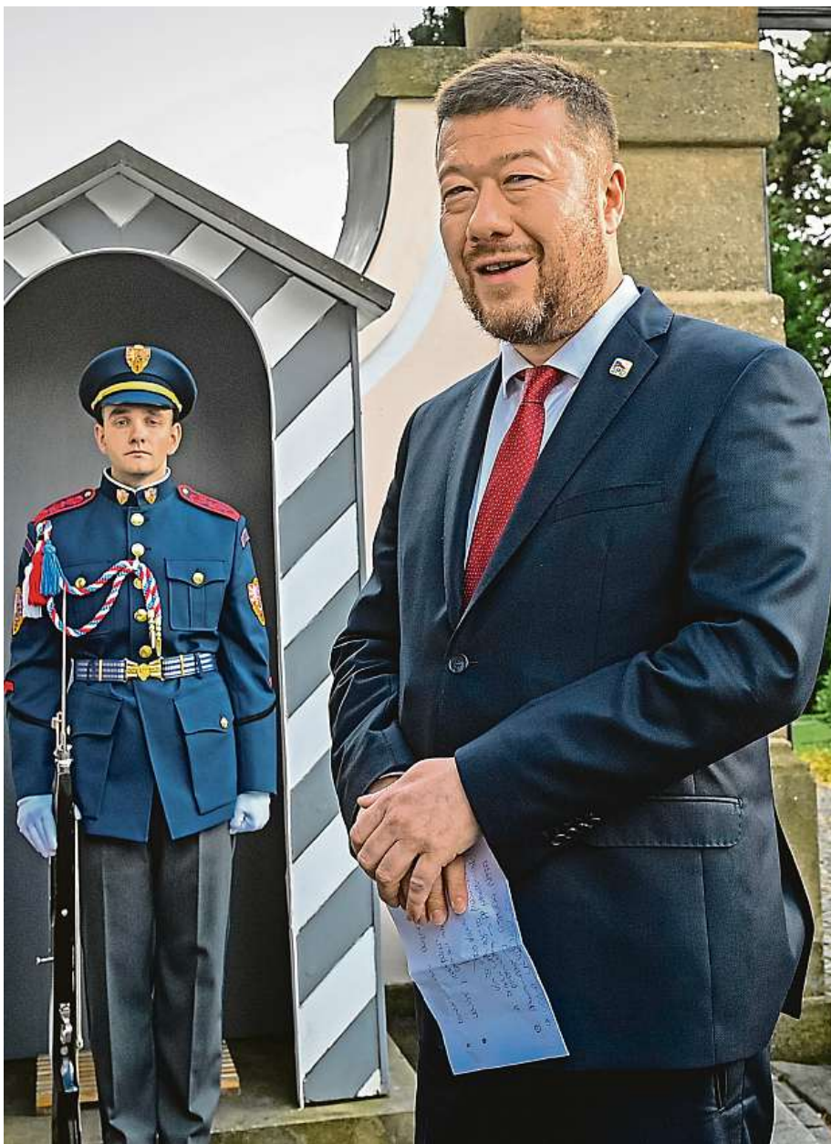
Tomio Okamura prožil poslední čtyři roky jako místopředseda Poslanecké sněmovny.

Ano, psal. Například v dětství, když jsem chodil do Skauta.