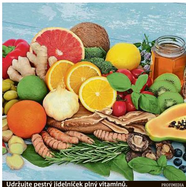
Udržujte pestrý jídelníček plný vitamínů.

Vyřaďte z jídelníčku rafinovaný cukr, který přispívá k přemnožení plísni a kvasinek ve střevě. Tělo ho pro svou funkci nepotřebuje, stačí mu cukr přírodní, který dostane z běžné stravy. Pokud už sladit musíte, volte raději med nebo třtinový cukr. Imunitě škodí i přílišná konzuma-