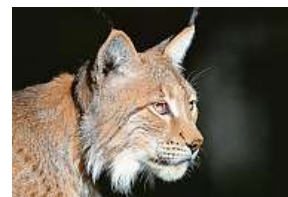
Rys v Jeseníkách