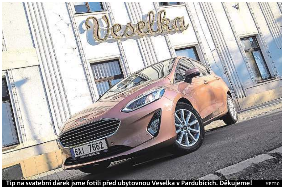
Tip na svatební dárek jsme fotili před ubytovnou Veselka v Pardubicích. Děkujeme!

Co třeba povede- nou novou fiestu v lososové barvě?