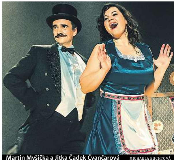
Martin Myšička a Jitka Čadek Čvančarová