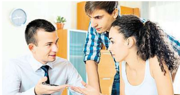
Nechat si zhodnotit peníze lze různými způsoby.

Bohužel jsou i zlé časy, ceny kolísají. A pak může dojít i ke ztrátám. Z důvodu zkládacích poplatků a účasti pouze na rostoucích cenách lze všeobecně říci, že investice do akcií přichází v úvahu pro větší částky, rovněž je zpravidla zvolena delší doba uložení, aby bylo možné počkat na zotavení kurzu.