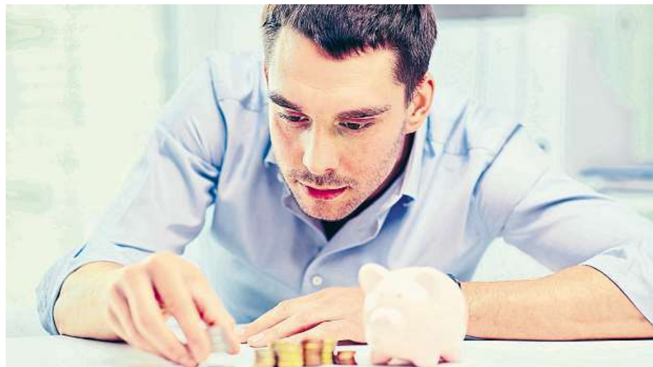
Investovat správně své peníze není zrovna snadná věc.

Čím dál více zájemců investuje v podílových fondech. Za poslední dva roky narostl objem majetku v těchto fondech o více než třetinu a na konci prvního pololetí zde měli investoři z řad domácích i firem naspořeno přes 400 miliard korun.