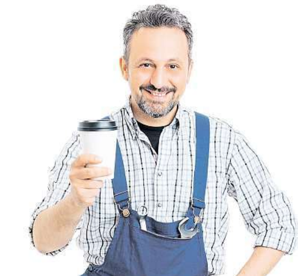
V nové práci můžete být o poznání šťastnější.

Zaměstnanci v Česku jsou podle průzkumů poměrně konzervativní, časté střídání zaměstnavatelů je u nás vnímáno spíše negativně. V anketě z konce loňského roku asi třetina respondentů jako ideální dobu pro setrvání v jednom zaměstnání uvedla 4 až 6 let. Pracovní trh se ale mění, zaměstnanci už nemají strach o místo a jsou poziti-