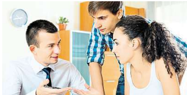
Nechat si zhodnotit peníze lze různými způsoby.

Bohužel jsou i zlé časy, ceny kolísají. A pak může dojít i ke ztrátám. Z důvodu základních poplatků a účasti pouze na rostoucích cenách lze všeobecně říci, že investice do akcií přichází v úvahu pro větší částky, rovněž je zpravidla zvolena delší doba uložení, aby bylo možné počkat na zotavení kurzu.