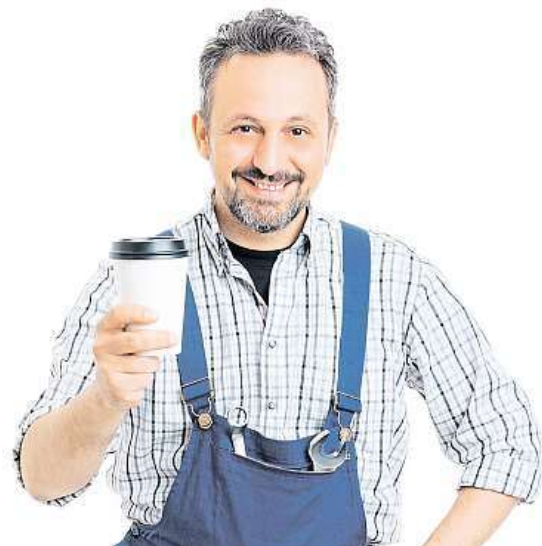
V nové práci můžete být o poznání šťastnější.