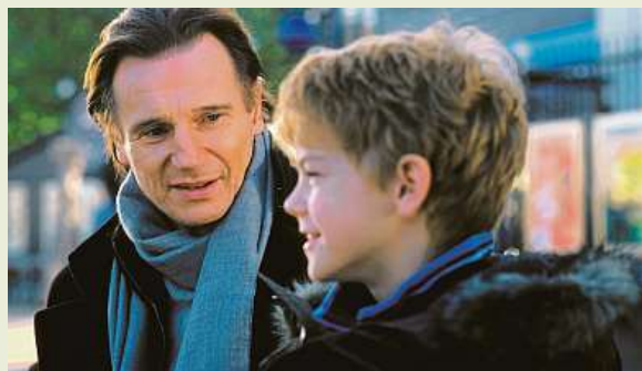
Láska nebeská je romantická komedie natočená v koprodukcí Velké Británie, Francie a USA. Neeson zde hrál otčíma.

• Non-Stop , stejně jako podobně laděného Cizince ve vlaku, natočil režisér Jaime Collet-Serra. Po sólové akci v letadle a ve vlaku jej udržel ve stíněném a uzavřeném prostředí i v aktuální Jízdě smrti , a to