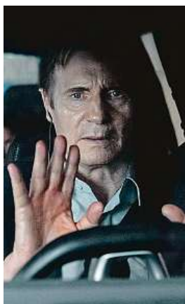
Hlavní atrakcí filmu Nimród Antal je účast Neesona.