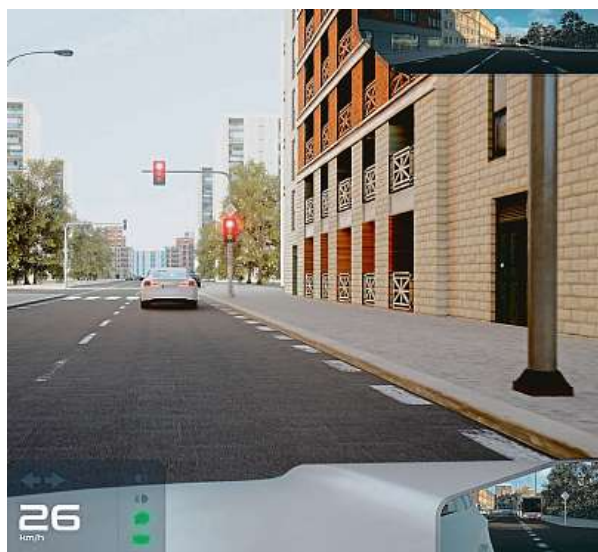
Zástupci asociace autoškoly tvrdí, že po zařazení podobných videí do výuky klesla dle kolegů z Velké Británie nehodovost o 30 procent.