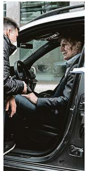
Americkému bankéři dají jednoho dne do auta bombu.

s dvěma dětmi. Mými filmovými dětmi. To mi právě připadalo velmi zajímavé. Sedíme spolu v rodinném autě, které je v podstatě časovanou bombou. A tak jsem pod tlakem, abych zachránil situaci a samozřejmě životy „svých“ dětí. Mimochodem, mé dvě filmové děti sedí téměř celý film na zadních sedadlech zmiňovaného auta, což není vůbec snadné. Hrají je Lily Aspellová a Jack Champion, dva mimořádně talentovaní mladí herci.