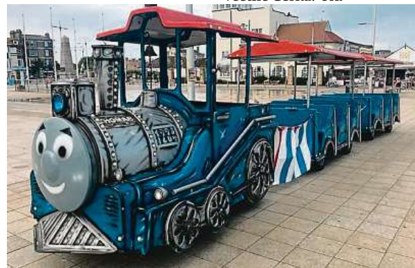
Lokomotiva Tomáš baví děti od roku 1984.

Knižní postavu lokomotivy Tomáše vytvořil pro svého dvouletého syna britský duchovní Wilbert Awdry. První knihu o parní lokomotivě s lidskou tváří napsal v roce 1942, aby rozptýlil nemocného potomka. Podle knižní předlohy pak vznikl animovaný seriál. Dnes tato značka vyneše ročně miliardu liber a seriál s hrdiny Awdryho knih sledují děti ve 185 zemích včetně Česka. ČTK