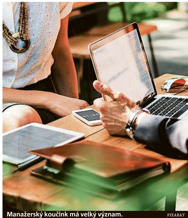
Manažerský koučink má velký význam.

Manažerský koučink má velký význam při rozvoji emoční inteligence zaměstnanců a jejich kompetencí. Díky pozitivnímu vlivu na zvyšování výkonnosti se stává účinnou prevencí proti syndromu vyhoření. Koučink má, je-li dobře ovládnán, při vedení lidí nezastupitelné místo. Když ho manažer zvládne, bude se mu lépe komunikovat s podřízenými. Ve své firmě musí vytvořit příjemné prostředí, kde jsou potřeby podřízených v souladu s potřebami firmy. Pozitivní nálada a nadšení vytlačí strach a lhostejnost, dobrá vůle a vstřícnost ke změnám vystřídají direktivní přístup a sami zaměstnanci budou denně motivováni k neustálému učení, zdokonalování se a vyšší pracovní výkonnosti. Tak se z manažera stane úspěšný a excelentní šéf.