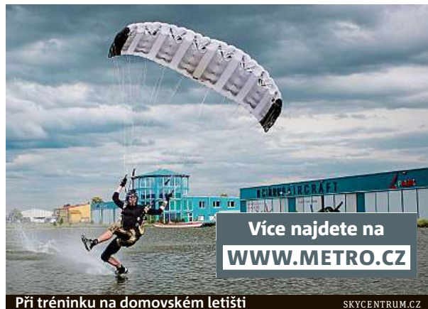
Při tréninku na domovském letišti

V rámci závodů se létají tři různé disciplíny, každá po třech skocích – rychlost, vzdálenost a přesnost. Při každé z disciplín závodník provádí na padáku vertikální zatáčku, při které se snaží nabrat co nejvyšší rychlost.