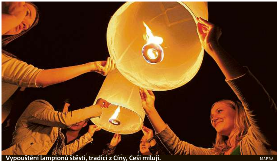
Vypouštění lampionů štěstí, tradicí z Číny, Češi milují.

Oheň spolkl brazilské muzeum. Zřejmě za něj může padající lampion štěstí. Také u nás kvůli nim hoří.