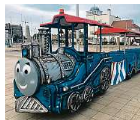
Mašinka Tomáš

Knižní postavu lokomotivy Tomáše vytvořil pro svého dvouletého syna britský duchovní Wilbert Awdry. První knihu o parní lokomotivě s lidskou tváří napsal v roce 1942, aby rozptýlil nemocného potomka. Podle knižní předlohy pak vznikl animovaný seriál. Dnes tato značka vynese ročně miliardu liber a seriál s hrdiny Awdryho knih sledují děti ve 185 zemích včetně Česka.