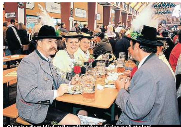
Oktoberfest láká milovníky piva už více než století. DZFT

Festival bude zahájen v sobotu 17. září v 11 hodin na Sonnenstrasse-Schwanthalerstrasse. Na tisíc účastníků se vám předvede v bavorských krojích, pojedou na koňských povozech a povezu pivo. Ve 12 hodin starosta města slavnostně otevře první sud. Kostýmová a vojenská přehlídka se uskuteční v neděli 18. září. Na sedmikilometrové trase ulicemi Mnichova potkáte vojenskou čet v historických uniformách, s pochodující kapelou, koňmi,