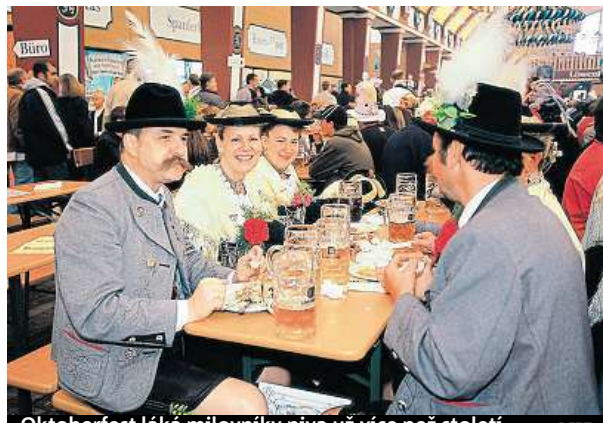
Oktoberfest láká milovníky piva už více než století. DZFT

Festival bude zahájen v sobotu 17. září v 11 hodin na Sonnenstrasse-Schwanthalerstrasse. Na tisíc účastníků se vám předvede v bavorských krojích, pojedou na koňských povozech a povezu pivo. Ve 12 hodin starosta města slavnostně otevře první sud. Kostýmová a vojenská přehlídka se uskuteční v neděli 18. září. Na sedmikilometrové trase ulicemi Mnichova potkáte vojenskou čet v historických uniformách, s pochodující kapelou, koňmi,