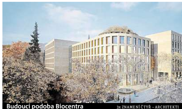
Budoucí podoba Biocentra

V plánu je postavit na Albertově dvě budovy vědecko-výzkumného a vzdělávacího charakteru s názvem Biocentrum a Globcentrum. Jde o první stavební investici Univerzity Karlovy po sto letech. Odhadované náklady by se měly vyšplhat na dva a půl miliardy korun. „Pokud půjde vše podle plánu, obě budovy budou stát již v roce 2020,“ říká Martin Tycar, jeden z trojice autorů vítězného návrhu. FILIP JAROŠEVSKÝ