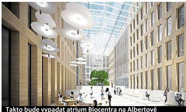
Takto bude vypadat atrium Biocentra na Albertově

U vítězného návrhu porota vyzdvihovala především urba-