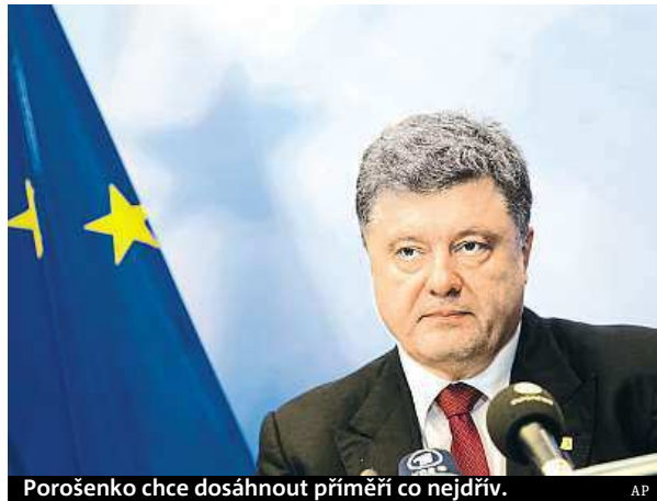
Poroshenko chce dosáhnout příměří co nejdřív.