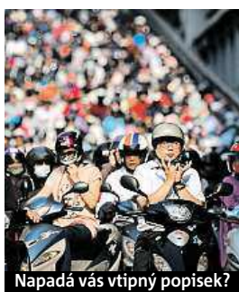
Napadá vás vtipný popisěk?

Napište bublinu a reagujte na sloupek na: www.facebook.com/denikmetro