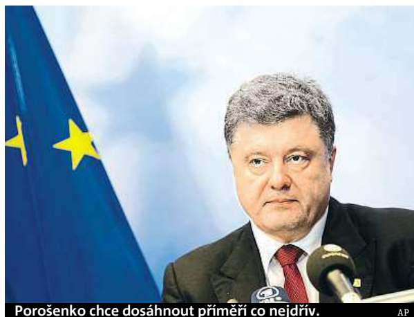
Poroško chce dosáhnout příměří co nejdřív.