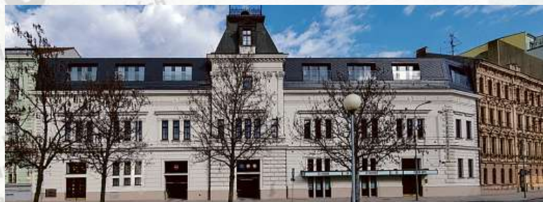
Investice roku 2021

Skupina e-Finance více jak 20 let investuje do nemovitostí v atraktivních lokalitách České republiky. Díky tomu disponuje stabilním portfoliem, zejména nájemních nemovitostí, v hodnotě přesahující 1 miliardu korun. Portfolio investic najdete na www.e-finance.eu .