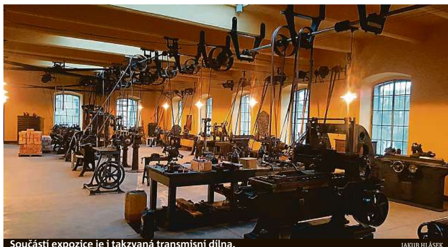
Součástí expozice je i takzvaná transmisní dílna.