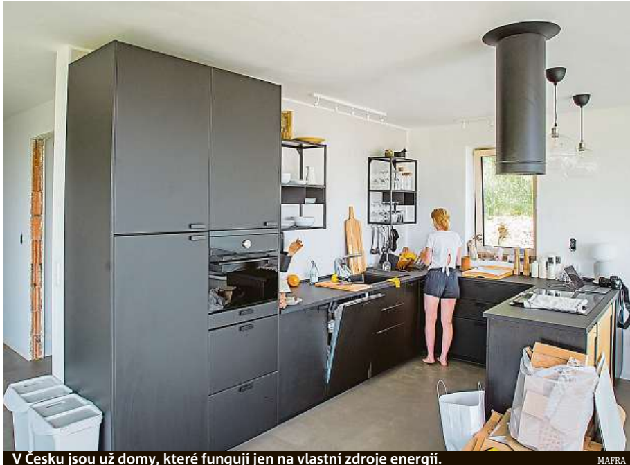
V Česku jsou už domy, které fungují jen na vlastní zdroje energií.

Spolehlivost takových zařízení zajistí baterie, buď v rámci každého zařízení, nebo na úrovni mikrosítě, případně v kombinaci obou. A pak ro-