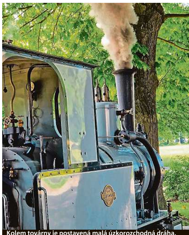
Kolem továrny je postavená malá úzkorozchodná dráha.

„Část železnice, která vede dvorem továrny, je postavená podle původní drážky, která sloužila k zauhlování místní kotelny,“ dodává Holota. Kromě toho se zdejší restaurátoři v posledních letech pustili i do provozování normálně rozchodných lokomotiv. V létě díky tomu pořádají každou sobotu parní jízdy na Králický Sněžník. Na webu Starestroje.eu najdete podrobnosti. ANEŽKA VONDRÁKOVÁ