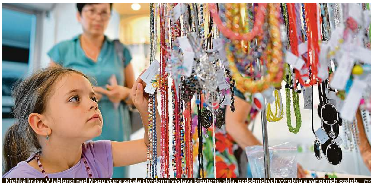
Křehká krása. V Jablonci nad Nisou včera začala čtyřdenní výstava bižuterie, skla, ozdobných výrobků a vánočních ozdob. ČTK

Covidová opatření. Silně se podepsala na plaveckých kurzech. Strmý pád. V září 2019 chodila do bazénů skoro půlka žáků prvního stupně, loni jen 13 procent. Náklady. Hradí je školy z peněz provozovatelů STRANA 2