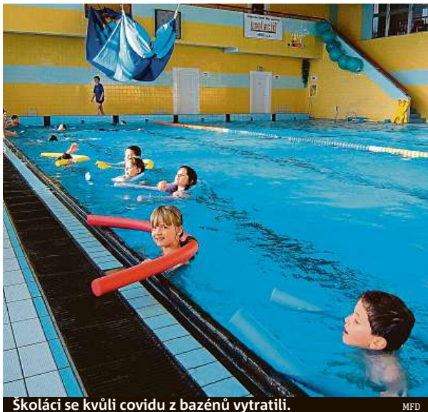
Školáci se kvůli covidu z bazénů vytrátili.

Na začátku uplynulého školního roku platila pro návštěvu bazénu podmínka předložení negativního testu na covid-19 či dokladu o očko-