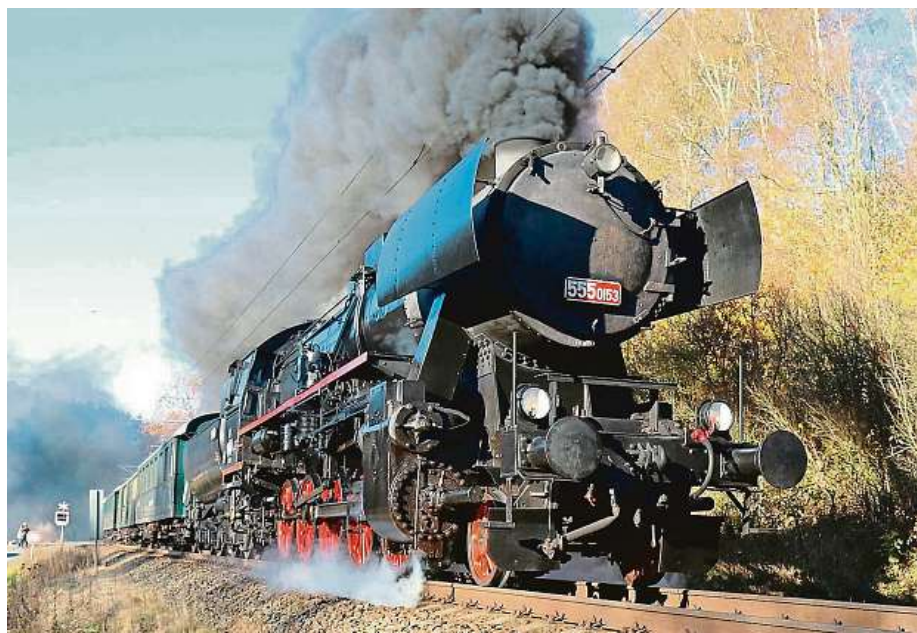
Muzeum pořádá i parní jízdy na Králický Sněžník.

Dvakrát ročně zde probíhají dny otevřených dveří, kdy