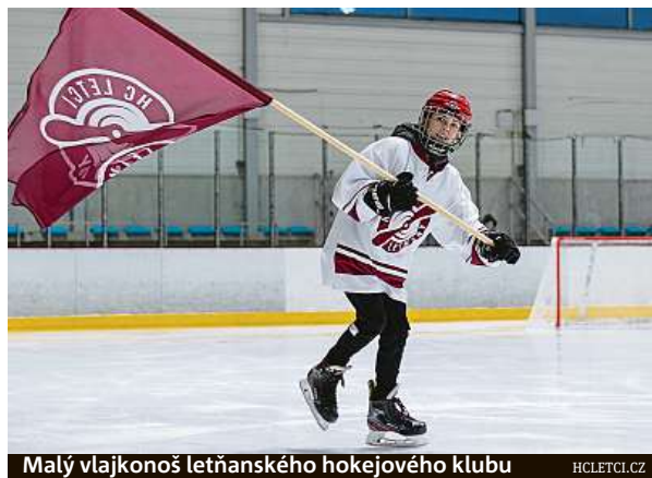
Malý vlajkonoš letňanského hokejového klubu