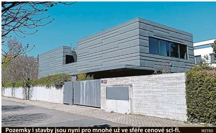
Pozemky i stavby jsou nyní pro mnohé už ve sféře cenové sci-fi.

V devadesátých letech prchali obyvatelé měst za jejich hranice. Pozemek a novostavba vyšly levněji než městský byt. Kam se ale vydat pro nové bydlení teď?