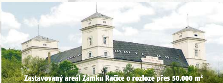
Zastavovaný areál Zámku Račice o rozloze přes 50.000 m 2

Koncern e-Finance, a.s. nabízí dluhopisy zajištěné zástavním právem na celém exkluzivním areálu Zámku Račice čítající pozemky o výměře přes 50 000 m 2 , nemovitosti a samotný Zámek Račice. Celé portfolio investic najdete na našich stránkách www.e-finance.eu .