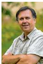
Petr Hamerník Zoo Praha