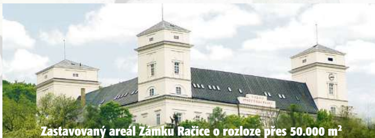
Zastavovaný areál Zámku Račice o rozloze přes 50.000 m 2

Koncern e-Finance, a.s. nabízí dluhopisy zajištěné zástavním právem na celém exkluzivním areálu Zámku Račice čítající pozemky o výměře přes 50 000 m 2 , nemovitosti a samotný Zámek Račice. Celé portfolio investic najdete na našich stránkách www.e-finance.eu .