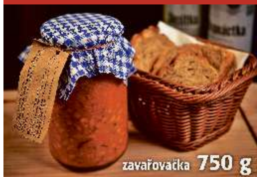
zavařovačka 750 g

ŠETŘETE ENERGIÍ, ČAS A PENÍZE - nakupujte hotová jídla z eFiShopu!