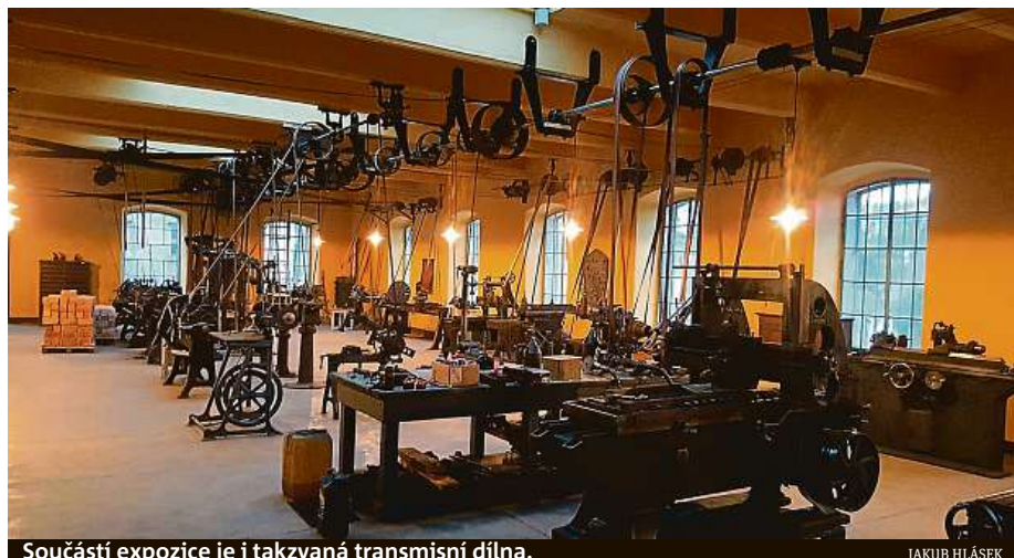
Součástí expozice je i takzvaná transmisní dílna.