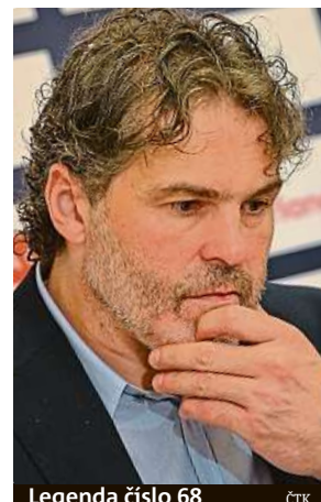
Legenda číslo 68