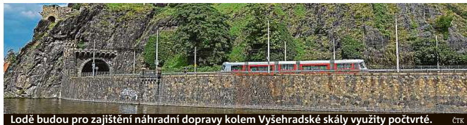
Loďe budou pro zajištění náhradní dopravy kolem Vyšehradské skály využity počtvrté. ČTK

ani cestující s dětskými kočárky. K přejezdu tunelem mezi Výtoň a Podolím bude také možné zdarma využít sdílená kola společnosti Rekola. ČTK