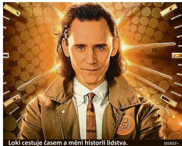
Loki cestuje časem a mění historii lidstva.

Kromě toho, že dojde k vytvoření takzvaného mnohovesmíru, nám jeho tvůrčí představitel nového záporáka. Přesněji řečeno nového Thanose, který bude trápit hrdiny nové éry marveláckého vesmíru. Tím není nikdo jiný než komiksový superpadouch Kang Dobyvatel (Jonathan Majors). Ten se měl