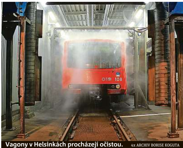
Vagony v Helsinkách procházejí očistou.

Na prohlídkách prostor metra v Moskvě doprovázel Koguta kvůli předpisům vedoucí tiskového oddělení jménem Artom. „Jednoho dne jsme navštívili dvě depa, poté jsme byli domluveni na večer-