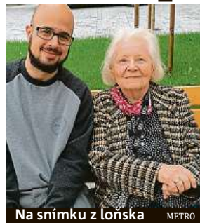
Na snímku z loňska METRO

„Jednou jsem slyšela v rozhlasu o způsobu pohřbívání lidí jako kompostu do země. A mě to nadchlo,“ svěčila se loni v červnu pro deník Met-