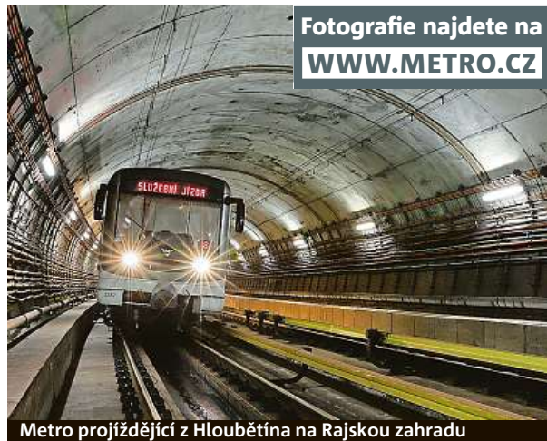
Fotografie najdete na WWW.METRO.CZ