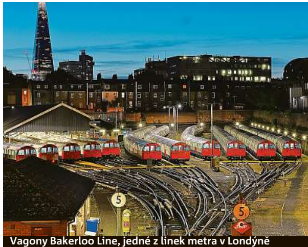
Vagony Bakerloo Line, jedné z linek metra v Londýně