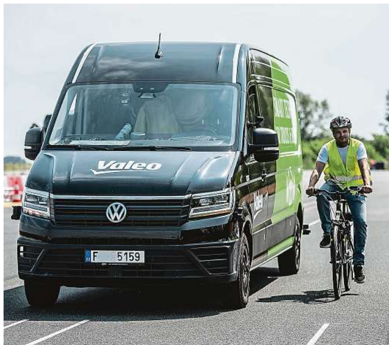
Testování přímo na různých typech dopravních prostředků je v plném proudu.