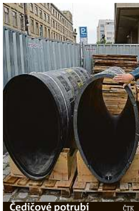
Čedičové potrubí