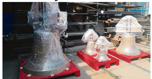
Zvonov před naložením do kamionu

podzim a v Haštalu na jaře příštího roku,“ uvedl jeden z organizátorů akce Ondřej Boháč. Zvonov budou vystaveny na dřevěných takzvaných kozách a lidé tak budou mít možnost si na ně zazvonit a slyšet jejich zvuk. Před zavěšením do zvonice pak budou všechny čtyři zvonov ještě vysvěceny. Náklady na výrobu, převoz a umístění zvonů dosáhnou téměř 1,5 milionu korun. ČTK