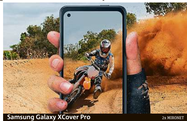
Samsung Galaxy XCover Pro

V internetovém obchodě Mironet tohoto odolného krasavce najdete za skvělou cenu 10 790 korun.