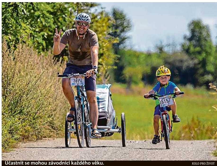
Účastnit se mohou závodníci každého věku.

Podrobnější informace ohledně závodů najdete na www.koloprozivot.cz .