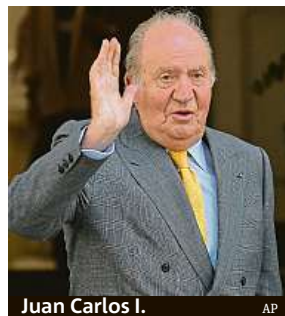
Juan Carlos I.

Někdejší král čelí podezření z korupce. Ze země zmizel bez manželky.