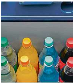
Vejde se až osm lahví.

Vyrážíte na výlet autem, na jehož konci vás čeká přespání pod stanem? A už jste přemýšleli nad tím, jak zařídit, abyste si večer, po dlouhém dni na cestách, mohli užít skvěle vychlazené pivo nebo jiný osvěžující drink? Anebo si naopak vezete teplou večer, kterou byste si i teplou rádi vychlazení? V takovém případě s sebou nemusíte tahat generátor, minibar, ani plotýnku.