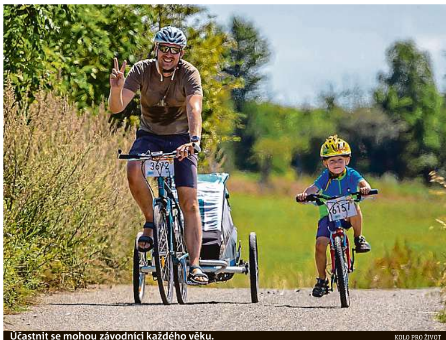
Účastnit se mohou závodníci každého věku.

Podrobnější informace ohledně závodů najdete na www.koloprozivot.cz .