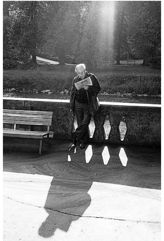
Jeden z vystavených snímků