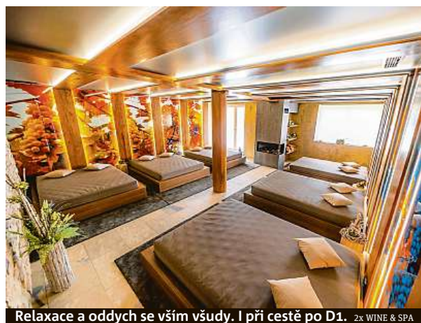
Relaxace a oddech se vším všudy. I při cestě po D1. 2x WINE & SPA