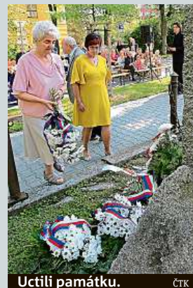
Uctili památku. ČTK

vykonstruovaných komunistických kauz. ČTK