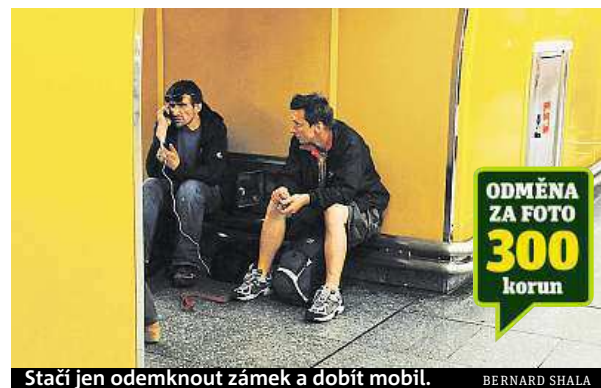
Stačí jen odemknout zámek a dobít mobil.

pravního podniku kontrolovány staničním personálem a hlídkami policie. Zároveň ale dopravní podnik žádá cestující, pokud mají podezření na páchnání jakékoliv „závadové“ činnosti, aby věc neprodlehně ohlásili dozorcům stanice či hlídce policie. ROW