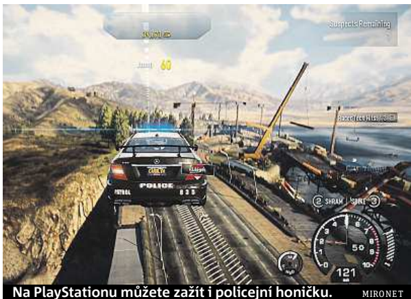
Na PlayStationu můžete zažít i policejní honičku. MIRONET

Krásy tohoto žánru by rád demonstroval závodní balíček PlayStation 4 z Mironetu, jehož součástí jsou hry Need For Speed Rivals, The Crew a Driveclub.