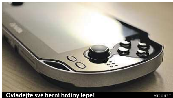
Ovládejte své herní hrdiny lépe! MIRONET

A právě toto je oblast, ve které je PlayStation Vita nejsilnější: směrové klávesy a míření zastupují ovládací páčky, zároveň však nechybí ani dotykový displej. Celý koncept ovládání je dotažen do takových extrémů, že ve hrách není problém s postavou běhat a šplhat a zároveň stíhat i míření zbraní. S něčím podobným mohou mít problémy i vyznačení klasického komba kláves-