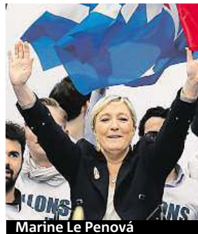
Marine Le Penová

Tématem číslo jedna ve francouzských místních volbách v regionu Calais budou přistěhovalci.