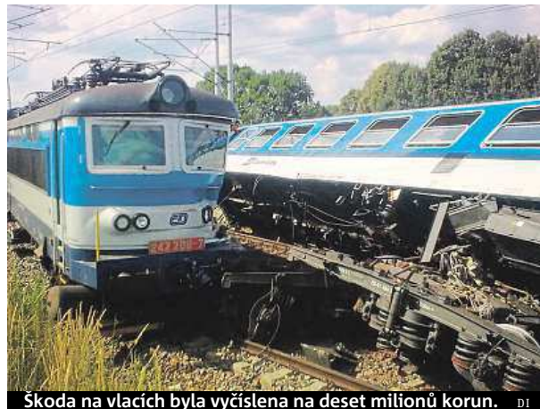
Škoda na vlacích byla vyčíslena na deset milionů korun. DI

Podle mluvčí ČD Radky Pistoriusové vykolejily zadní vagony u rychlíku Rožmberk a narazily do přední části rychlíku Vajgar. Stanice Horažďo-