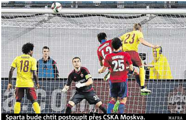
Sparta bude chtít postoupit přes CSKA Moskva. MAIRA

S velkými nadějemi vstupují fotbalisté Sparty a Plzně do odvet 3. předkola Ligy mistrů.