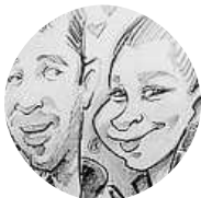
Kájinka Poštová Žitomířská ve Vršovicích. To je hrozný tankodrom.

Která ulice v Praze si zaslouží během léta opravu?