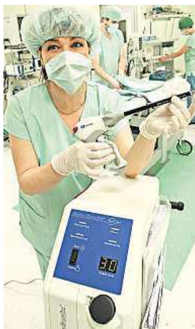
To je gama nůž.