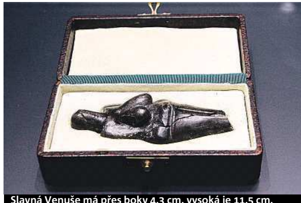
Slavná Venuše má přes boky 4,3 cm, vysoká je 11,5 cm.