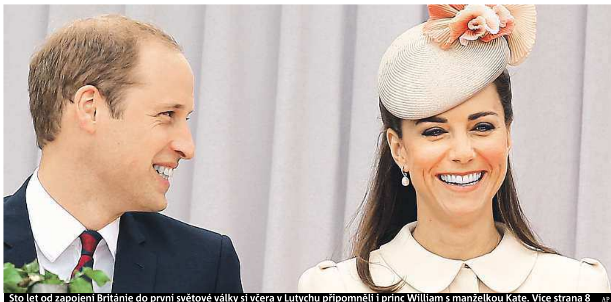
Sto let od zapojení Británie do první světové války si v Lutychu připomněli i princ William s manželkou Kate. Více strana 8

Jednotné zkoušky. Měly by fungovat od roku 2016. Ministr školství Chládek. „Velká část studentů nemá na střední škole co pohledávat.“ Ředitelé. Takové přijímací zkoušky by neměly být jediným kritériem STRANA 7