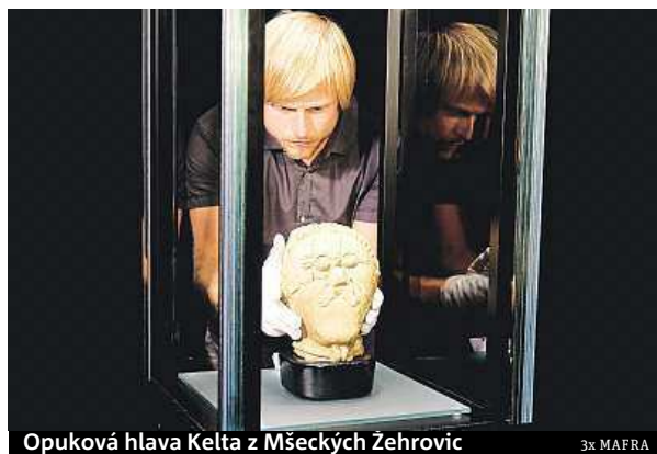
Opuková hlava Kelta z Mšeckých Žehrovic