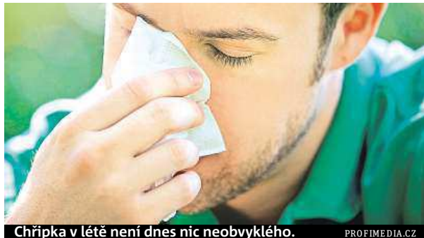
Chřipka v létě není dnes nic neobvyklého.

Kdo si v místnosti chlazené klimatizací navíc ještě dá