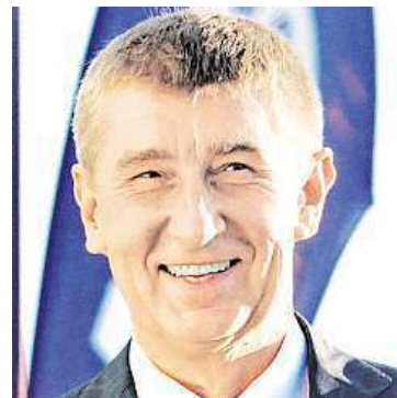
Šéf ANO Andrej Babiš

Volby do Poslanecké sněmovny by nyní vyhrálo hnutí ANO se ziskem 22,4 procenta hlasů. Druhá ČSSD zůstává téměř o tři procentní body. Do Sněmovny by se dostalo šest stran, Úsvit by již neuspěl. Oproti výsledkům předčasných voleb z loňského podzimu by si kromě hnutí ANO polepšili ještě komunisté. Vyplývá to z aktuálního průzkumu ppm factum. ČSSD by nyní získala 19,6 procenta, KSČM 17,7 procenta, TOP 09 a Starostové 11,2 procenta, ODS 6,3 procenta a lidovci 5,6 procenta. Těsně pod hranici vstupu do Sněmovny by zůstal Úsvit s 4,9 procenta. ČTK