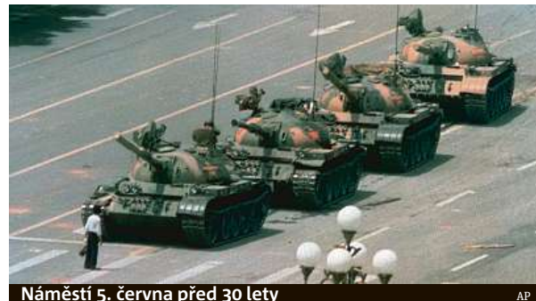
Náměstí 5. června před 30 lety

trum Pekingu střeží posílené pořádkové jednotky, disidenti museli odjet na nucenou dovolenou na venkov a restrikce se týkají i sociálních sítí. Například disident Chu Ťia, který je přítelem rodiny zesnulého a předtím dlouho vězněného nositele Nobelovy ceny za mír Liou Siao-poa, je už od 30. května v přístavním městě Čching-chuang-tao. „Je to odrazem jejich strachu, jejich hrůzy, ne naší,“ uvedl