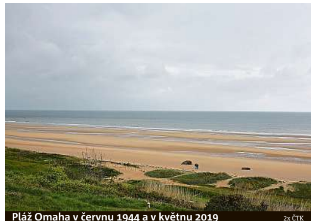
Pláž Omaha v červnu 1944 a v květnu 2019