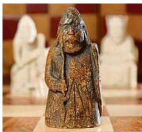
Figurka z 12. století

Vyvolávací cena je v přepočtu 17,5 milionu korun.