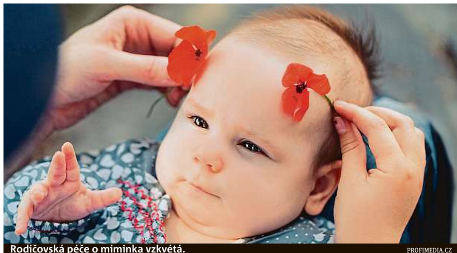
Rodičovská péče o miminka vzkvívá.

Statistiky porodnosti v evropských zemích nicméně ukazují, že ani dlouhá dovolená a vysoké finanční kompen-