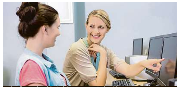
Chytře zvolená brigáda nastartuje kariéru.

Výbornou volbou bývá také letní brigáda v zahraničí. Mladý člověk získá nejen pracovní zkušenosti, ale zároveň se naučí fungovat samostatně. Navíc prohlubuje své znalosti cizích jazyků a poznává jiné kultury. MET