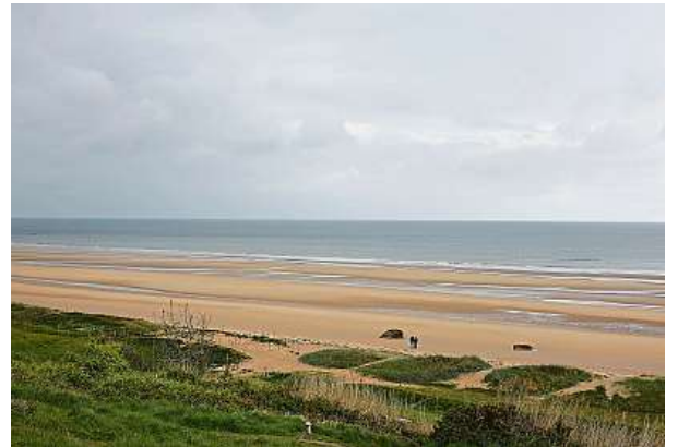
Pláž Omaha v červnu 1944 a v květnu 2019