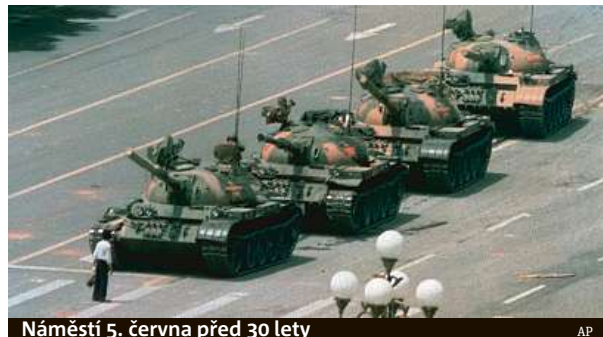
Náměstí 5. června před 30 lety

trum Pekingu střeží posílené pořádkové jednotky, disidenti museli odjet na nucenou dovolenou na venkov a restrikce se týkají i sociálních sítí. Například disident Chu Ťia, který je přítelem rodiny zesnulého a předtím dlouho vězněného nositele Nobelovy ceny za mír Liou Siao-poa, je už od 30. května v přístavním městě Čching-chuang-tao. „Je to odrazem jejich strachu, jejich hrůzy, ne naší,“ uvedl