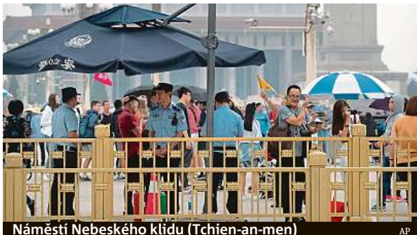
Náměstí Nebeského klidu (Tchien-an-men)