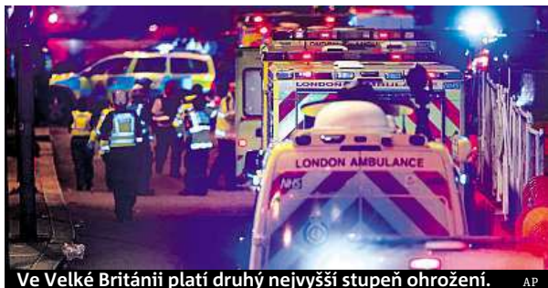
Ve Velké Británii platí druhý nejvyšší stupeň ohrožení.

Policie již podle BBC identifikovala všechny tři útočníky, ale zatím jejich jména nezveřejní. Včera zasáhli policisté ve čtvrti Barking. Prohledávali řadu bytů v oblasti, dvanáct lidí je ve vazbě, z toho něko-