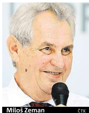
Miloš Zeman

Bývalý předseda Akademie věd Jiří Drahoš by byl podle 40 procent Čechů dobrým prezidentem.