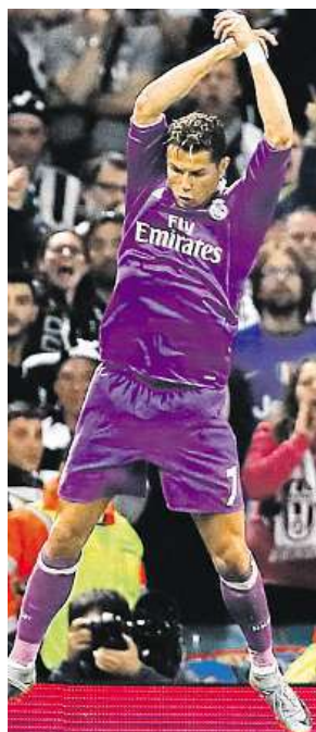
Ronaldova radost

„Tohle je největší klub na světě a ukazujeme to v každém zápase, který hrajeme.