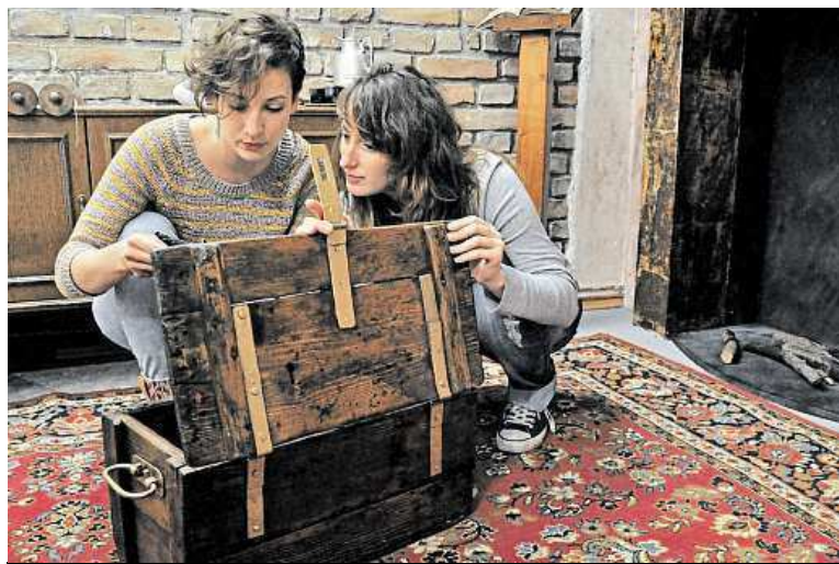
Vždy, když se vám povede něco otevřít, musíte přemýšlet, co dál.