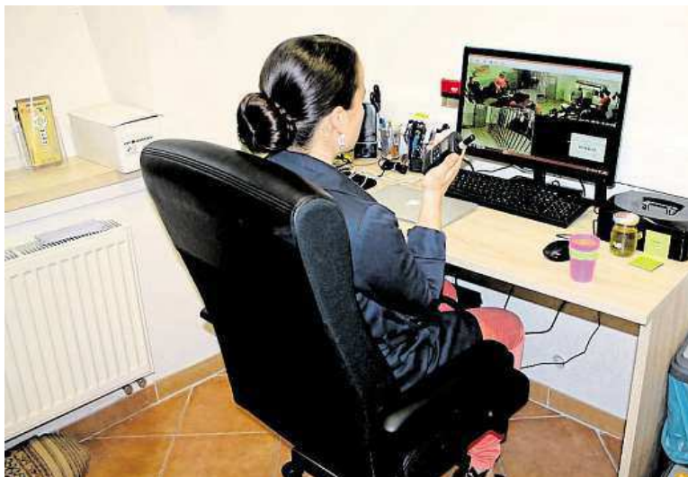
Snahu každé skupiny sledují operátoři a přes vysílačku mohou radit.