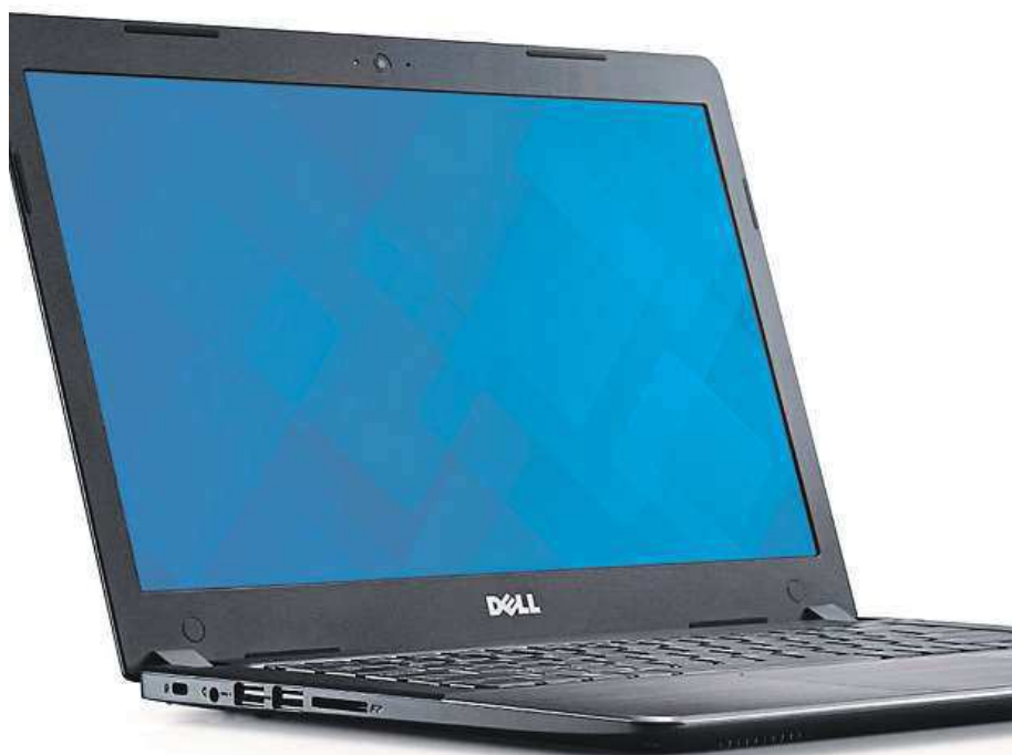
Dell Vostro 5480 váží i při své výbavě pouze 1,5 kg.

Třeba Dell Vostro 5480 je necelé dva centimetry tenký,