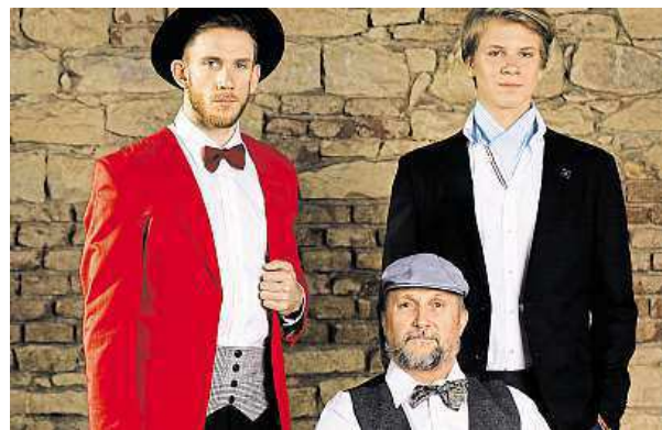
V sobotu bude v hlavní roli elegance.