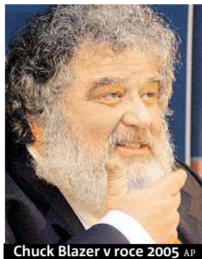
Chuck Blazer v roce 2005

Americké úřady odtajnily zápis ze slyšení u newyorského federálního soudu, při němž se v roce 2013 přiznal někdejší dlouholetý člen výkonného výboru FIFA Chuck Blazer k vydírání a úplatkářství. Vážně nemocný funkcionář mimo jiné potvrdil, že on a další členové FIFA dostali zapláceno za hlasy pro JAR ve volbách dějiště mistrovství světa 2010, korupce podle něho provázela i volby pořadatele MS 1998 a týkala se