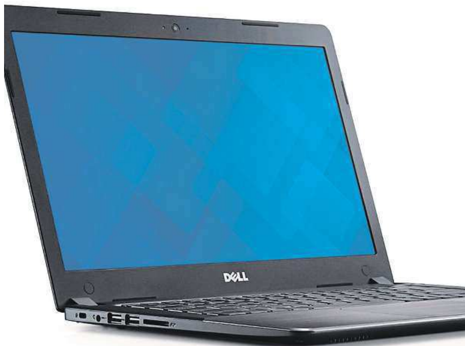
Dell Vostro 5480 váží i při své výbavě pouze 1,5 kg.

Třeba Dell Vostro 5480 je necelé dva centimetry tenký,