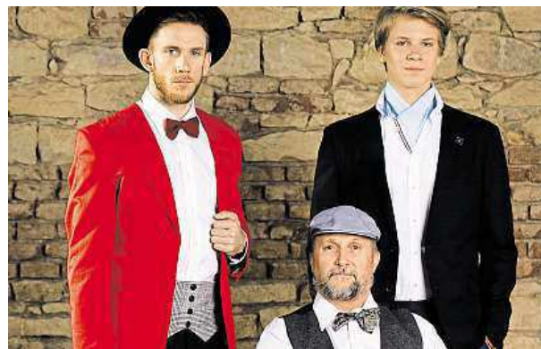
V sobotu bude v hlavní roli elegance.