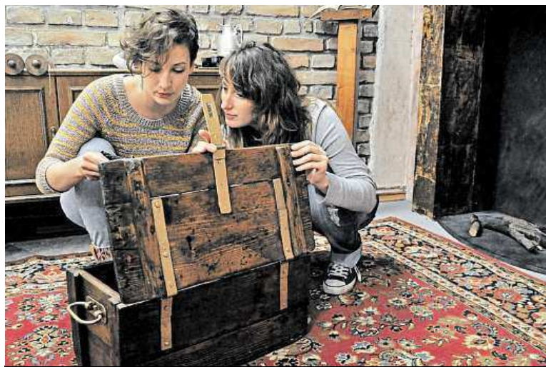
Vždy, když se vám povede něco otevřít, musíte přemýšlet, co dál.