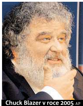
Chuck Blazer v roce 2005

Americké úřady odtajnily zápis ze slyšení u newyorského federálního soudu, při němž se v roce 2013 přiznal někdejší dlouholetý člen výkonného výboru FIFA Chuck Blazer k vydírání a úplatkářství. Vážně nemocný funkcionář mimo jiné potvrdil, že on a další členové FIFA dostali zapláceno za hlasy pro JAR ve volbách dějiště mistrovství světa 2010, korupce podle něho provázela i volby pořadatele MS 1998 a týkala se