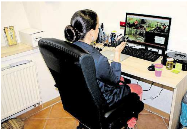
Snahu každé skupiny sledují operátoři a přes vysílačku mohou radit.