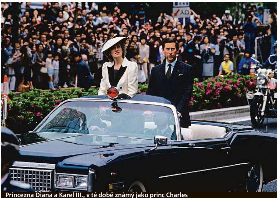
Princezna Diana a Karel III., v té době známý jako princ Charles