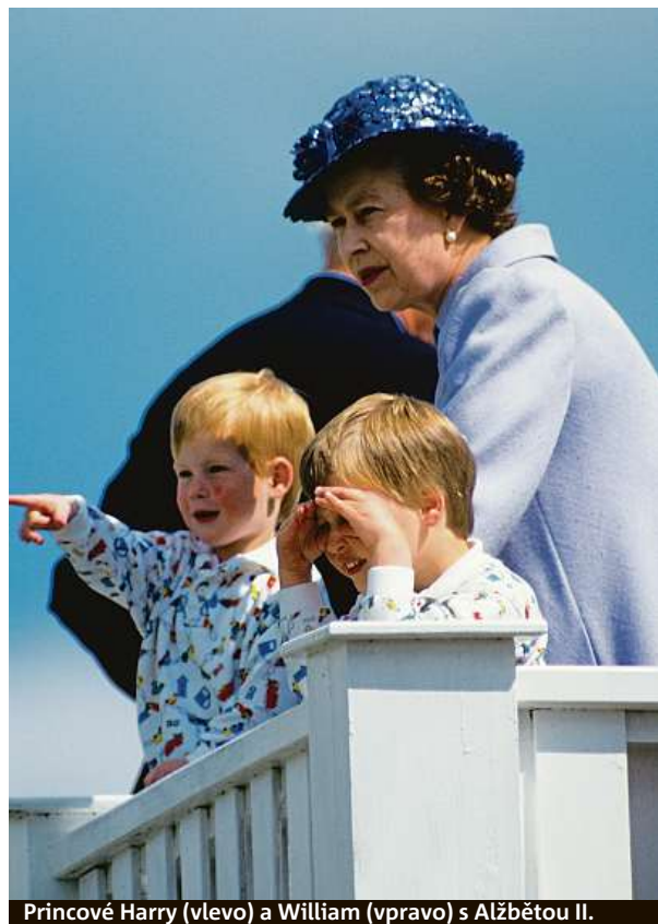
Princové Harry (vlevo) a William (vpravo) s Alžbětou II.