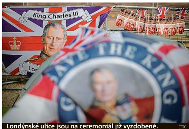
Londýnské ulice jsou na ceremoniál již vyzdobené. ČTK