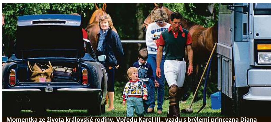
Momentka ze života královské rodiny. Vpředu Karel III., vzadu s brýlemi princezna Diana