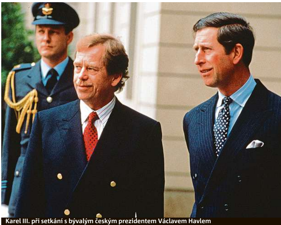
Karel III. při setkání s bývalým českým prezidentem Václavem Havlem

To je bohužel pravda a bylo nejspíš nevyhnutelné, že se jejich vztah rozpadl. Diana byla příliš mladá na takové povinnosti, které její role vyžadovala. Jako fotograf se nikdy nedostanete tak blízko, abyste členy královské rodiny mohl opravdu poznat, ale to, co jsem měl možnost vidět, byli dva dobří lidé se