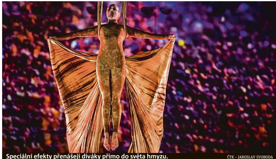
Speciální efekty přenášejí diváky přímo do světa hmyzu.