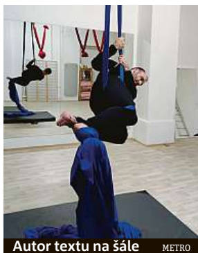
Autor textu na šále METRO

Po menší pauze se ale vrhám na další výzvy. Leje ze mě pot, ale za zvuků rockové hudby hledám nové síly, jak se vypořádat s tím kusem látky visícím ze stropu.