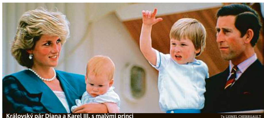
Královský pár Diana a Karel III. s malými princí