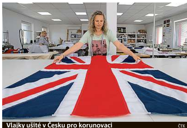
Vlajky ušité v Česku pro korunovaci ČTK