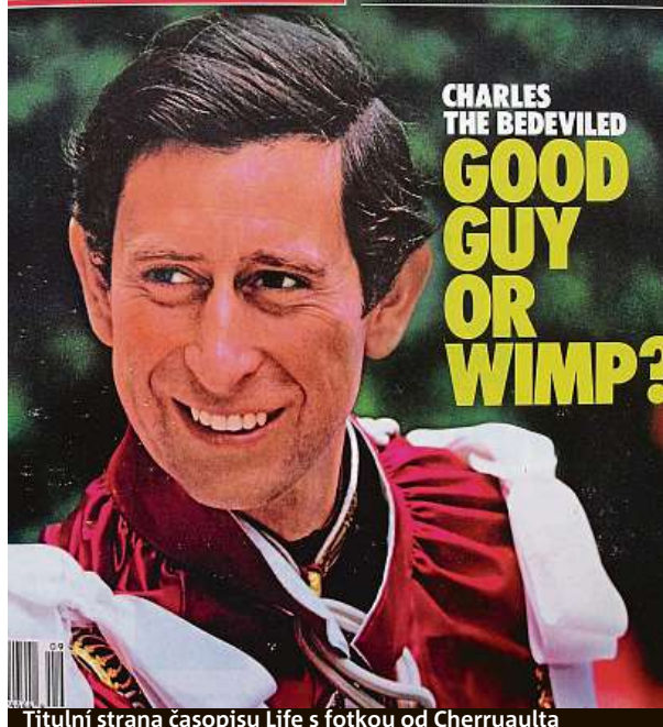
Titulní strana časopisu Life s fotkou od Cherruaulta