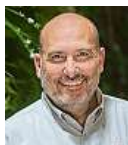
Miroslav Bobek Zoo Praha