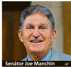
Senátor Joe Manchin

Manchin sem s oblibou vze své politické přátele i nepřátele na pivo, pizzu a večerní