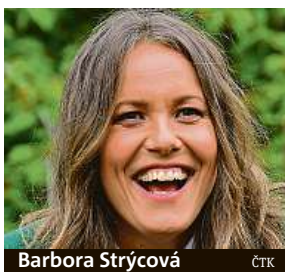
Barbora Strýcová

„Sama pro sebe si chci zahrát ještě jeden zápas s diváky. Loučím se s kariérou a nepředpokládám, že se vrátím na okruh, ale chtěla bych mít rozlučku s fanoušky,“ řekla Strýcová novinářům v sídle Českého olympijského výboru. Poslední zápas odehraje až po narození syna.