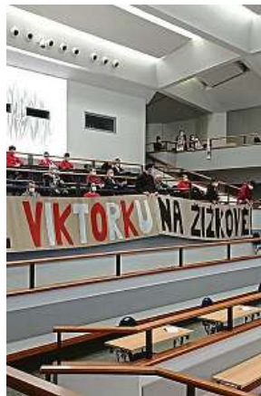
Zastupitelstvo Prahy 3 – nejdřív naděje, pak smutek. FKVZ1903

„Klub splňuje požadavky na splnění licence a chybí pouze položka stadionu, který je v majetku městské části. Předložili jsme zastupitelům