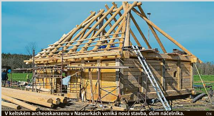
V keltském archeoskanzenu v Nasavrkách vzniká nová stavba, dům náčelníka.