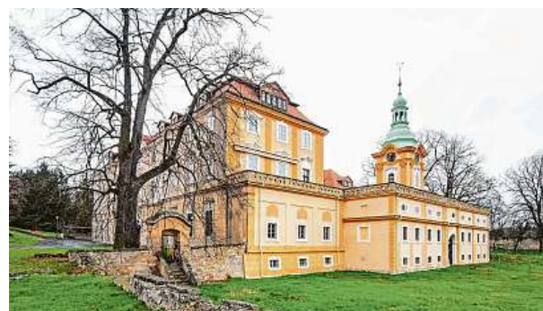
Zámek byl od roku 1871 sídlem továrníka Josefa Schrolla.

Iniciativa Prázdné domy eviduje opuštěné objekty v Česku. Podle databáze iniciativy je takových domů, pomíne-li Prahu, nejvíce na severu Čech. V Teplicích a Duchcově je shodně 54 prázdných domů. Třetí obcí v tomto žebříčku je Ústí nad Labem (48 prázdných domů).