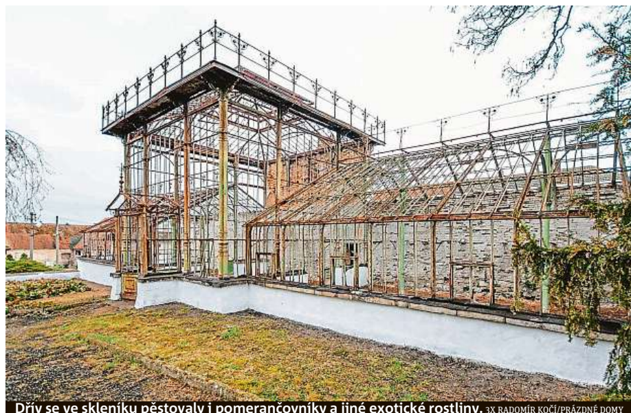
Dřív se ve skleníku pěstovaly i pomerančovníky a jiné exotické rostliny.

Vůz Škoda Fabia patří ke stálícím v nabídce české automobilky. Nyní vstupuje na trh čtvrtá generace. Firma vyrobila 4,6 milionu těchto vozů, nejvíce jich připadá na první generaci – 1,8 milionu vozů.