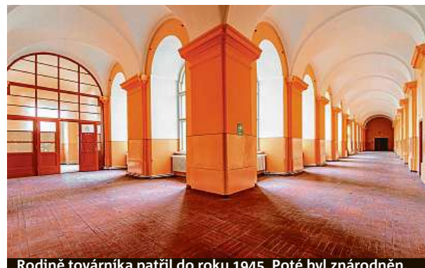
Rodině továrníka patřil do roku 1945. Poté byl znárodněn.