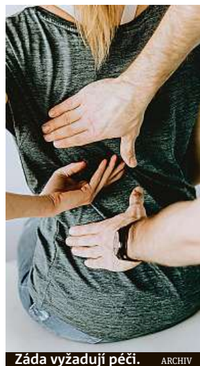
Záda vyžadují péči.