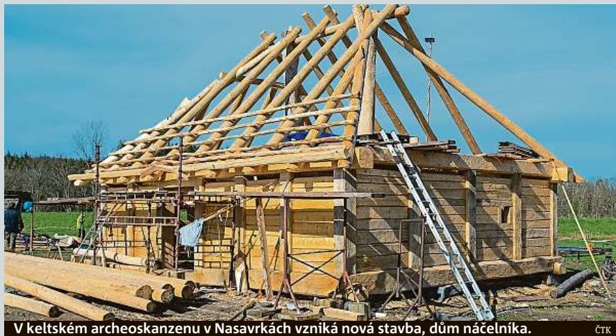
V keltském archeoskanzenu v Nasavrkách vzniká nová stavba, dům náčelníka.