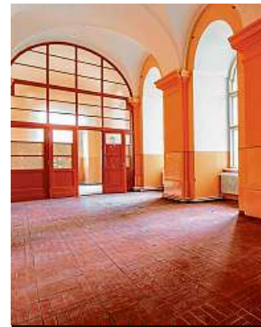
V roce 1945 byl znárodněn.