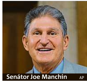
Senátor Joe Manchin

Manchin sem s oblibou vze své politické přátele i nepřátele na pivo, pizzu a večerní