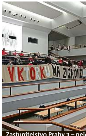
Zastupitelstvo Prahy 3 – nejdřív naděje, pak smutek. FKVZ1903

„Klub splňuje požadavky na splnění licence a chybí pouze položka stadionu, který je v majetku městské části. Předložili jsme zastupitelům