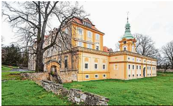
Zámek byl sídlem továrníka Josefa Schrolla.

Iniciativa Prázdné domy eviduje opuštěné objekty v Česku. Podle databáze iniciativy je takových domů, pomine-li Prahu, nejvíce na severu Čech. V Teplících a Duchcově je shodně 54 prázdných domů. Třetí obcí v tomto žebříčku je Ústí nad Labem (48 prázdných domů).