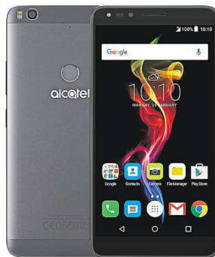
Vyzkoušejte Alcatel POP 4 (6).

S přihlédnutím k ceně 6490 korun, za kolik ho můžete pořídit v internetovém obchodě Mironet, budete výhodnější phablet hledat jen stěží.