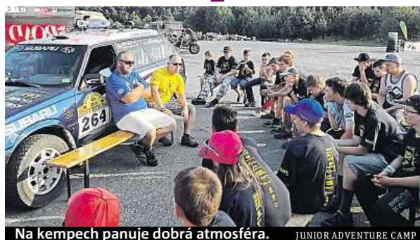
Na kempech panuje dobrá atmosféra.

Každý z turnusů (21. až 30. července nebo 4. až 13. srpna) je takovým intenzivním sportovním soustředěním maximálně pro 30 dětí. Tábory probíhají v areálu Motorland Bělá (Bělá pod Bezdězem) nedaleko Mladé Boleslavi. Zájemci z řad dětí od 7 do 17 let se zde naučí základním návykům závodních jezdců nebo své závodnické smysly prohloubí. Mimo všechny zážitkové motoristické aktivity je velký důraz kladen na kurzy z oblasti první pomoci při nehodě či jiném úrazu ze silničního provozu, prezentace branně-bezpečnostních složek (policie, hasiči, záchranka) pod taktovkou Besipu, ale také jsou oblibenými disciplínami sportovní, jako horská kola, místní koupaliště s mí-