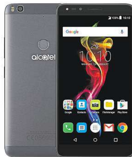
Vyzkoušejte Alcatel POP 4 (6).

S přihlédnutím k ceně 6490 korun, za kolik ho můžete pořídit v internetovém obchodě Mironet, budete výhodnější phablet hledat jen stěží.