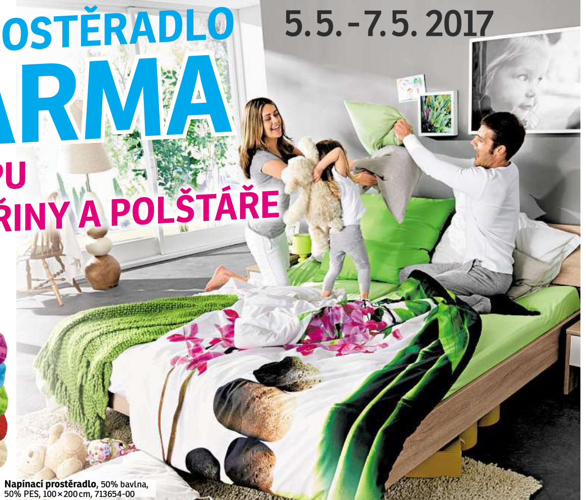
Napínací prostěradlo, 50% bavlna, 50% PES, 100×200 cm, 713654-00

Nabídka platí od 5. 5. - 7. 5. 2017 nebo do vyprodání zásob ve všech prodejnách ASKO - NÁBYTEK v ČR vyjma nabídky z e-shopu www.asko.cz . Nabídka platí při nákupu setu polštář (70 x 90 cm) a peřina (140 x 200 cm) dle vlastního výběru. Nevztahuje se na akční a již zlevněné zboží. Platí pouze na nově uzavřené zakázky. Více informací v prodejnách ASKO - NÁBYTEK v ČR.