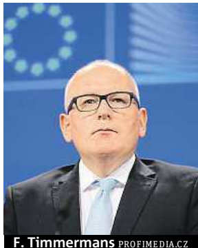
F. Timmermans

Určení zvládnutelného počtu žadatelů bude záviset na velikosti a bohatství dané