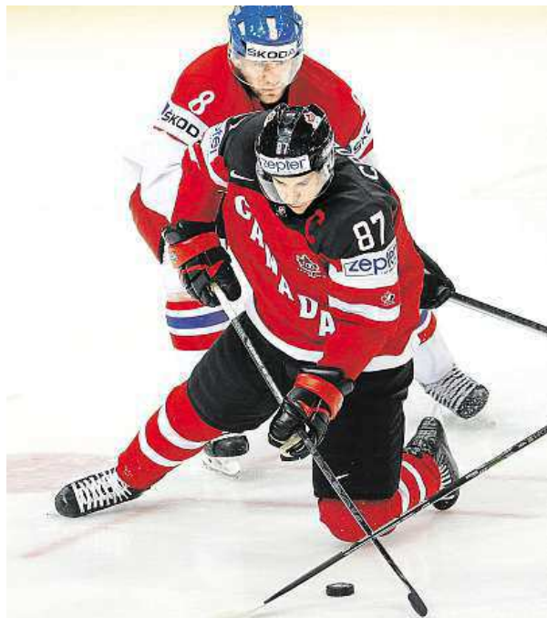
Marně se Češi snažili zastavit rozjetou Kanadu.