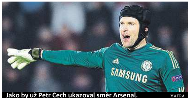
Jako by už Petr Čech ukazoval směr Arsenal.

Jelikož už je v Londýně za jedenáct let zvyklý, stejně jako jeho rodina, budou jeho další kroky zřejmě směřovat do konkurenčního Arsenalu. Chelsea chce za dvaatřicetiletého brankáře minimálně de-