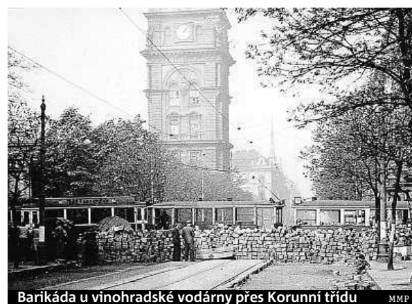
Barikáda u vinohradské vodárny přes Korunní třídu