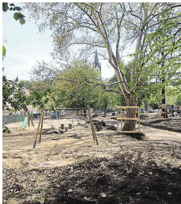
Novou podobu bude mít také dětské hřiště.

Pokud vše půjde dle plánu, bude čtyřicetistimilionová rekonstrukce náměstí financovaná z evropských fondů. FILIP JAROŠEVSKÝ