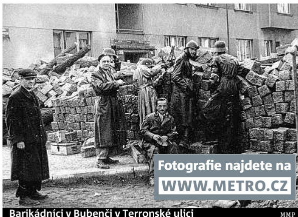
Barikádníci v Bubenči v Terronské ulici

• Výstavu fotografií nazvanou Praha 4 na barikádách najdete v parku na Pankráci. Více než šest desítek dobových fotografií na 32 panelech dokumentuje události z května 1945, kdy Praha povstala proti nacistické okupaci. ROW