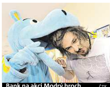
Bank na akci Modrý hroch

Nyní se cítí Bank relativně dobře a kromě ježdění na kole už také pla-