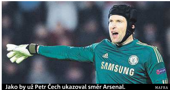
Jako by už Petr Čech ukazoval směr Arsenal.

Jelikož už je v Londýně za jedenáct let zvyklý, stejně jako jeho rodina, budou jeho další kroky zřejmě směřovat do konkurenčního Arsenalu. Chelsea chce za dvaatřicetiletého brankáře minimálně de-