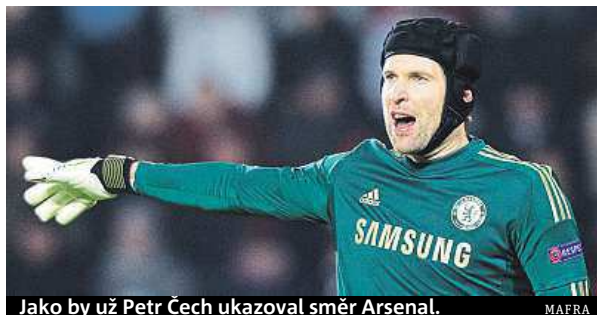
Jako by už Petr Čech ukazoval směr Arsenal.

Jelikož už je v Londýně za jedenáct let zvyklý, stejně jako jeho rodina, budou jeho další kroky zřejmě směřovat do konkurenčního Arsenalu. Chelsea chce za dvaatřicetiletého brankáře minimálně de-