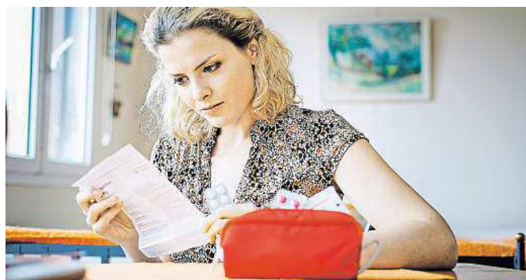
Lékárna je důležitá součást výbavy na dovolenou.

Jak si zabalit lékárníčku na dovolenou a přitom na nic důležitého nezapomenout? Jako všechno, i balení lékárníčky chce systém. Pokud se nechcete zatěžovat drobnostmi jako náplast, obvaz či dezinfekce, můžete si v lékárně koupit již připravenou základní sestavu. K ní už si doplňte léky, buď na žaludeční nevolnosti, nebo ty, které pravidelně užíváte. To už záleží také na destinaci, do které cestujete, a na vašem zdravotním stavu.