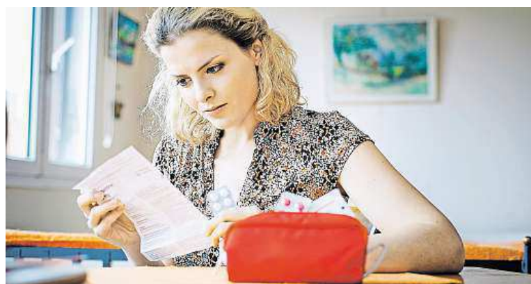
Lékárna je důležitá součást výbavy na dovolenou. PROFIMEDIA.CZ

Jak si zabalit lékárníčku na dovolenou a přitom na nic důležitého nezapomenout? Jako všechno, i balení lékárníčky chce systém. Pokud se nechcete zatěžovat drobnostmi jako náplast, obvaz či dezinfekce, můžete si v lékárně koupit již připravenou základní sestavu. K ní už si doplňte léky, buď na žaludeční nevolnosti, nebo ty, které pravidelně užíváte. To už záleží také na destinaci, do které cestujete, a na vašem zdravotním stavu.