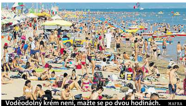
Voděodolný krém není, mažte se po dvou hodinách.

Při pravidelných kontrolách lze problematické znaménko neboli melanom odhalit včas, vyříznout je a pacient má skvělé vyhlídky na uzdravení. „Nelze jednoznačně říct, jak vypadá melanomové znaménko. Říkám svým pacien-