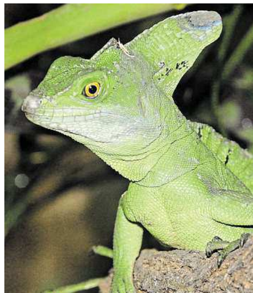
Komodo dragon from islands in Indonesia is the largest living species of lizard (left). Jesus Christ lizard is native to Central America (right)