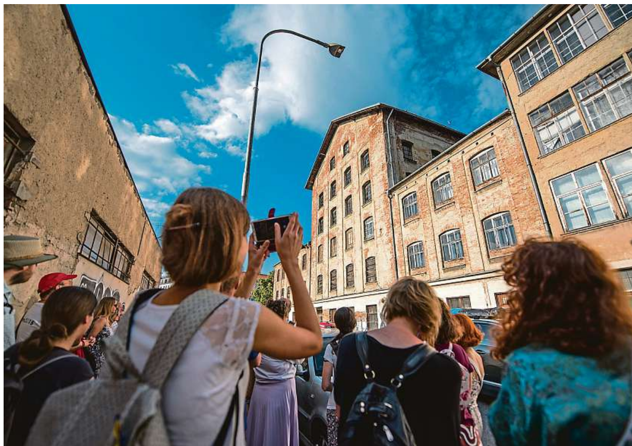
Kam se můžete jít podívat? Vyrazit můžete třeba po stopách průmyslových baronů.

Samostatně bez potřeby průvodce si lze projít stezkou Poznejte moravský Manchester nebo naučnou Industriální stezku podél řeky Svitavy. Ta na jedenácti zastaveních představuje stejný počet konkrétních průmyslových staveb posvitavské výrobní zóny, jež značí významný kus historie města Brna. Moravský Manchester si můžete zahrát také jako poznávací hru. „Výčetem těchto aktivit rozhodně nekončíme. Na jaře připravujeme další novinku, a to industriální aplikaci s rozšířenou realitou, která obohatí procházku po Industriální naučné stezce podél řeky Svitavy. Součástí budou autentické 3D modely továren a interaktivní hry,“ uzavírá Janulíková.