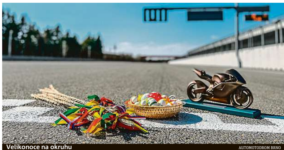
Velikonoce na okruhu

Možnost procházky po závodní trati nabízí už několik týdnů Masarykův okruh. Tu vůbec poslední budou mít zájemci právě na Velikonoční pondělí. Při této příležitosti zástupci Automotodromu Brno připravili originální program. „Nachystali jsme doprovodný program s motoristickou tematikou, balíček pozornosti pro děti a speciální stanoviště pro splnění velikonoční „povinnosti“. Na návštěvníky čekají stanoviště, na nichž se dozvědí zajímavosti ze světa motorsportu, mimo jiné to, co znamená vlajková signalizace při závodech, jak vypadá okruhový safetý car nebo hasičské auto či kolik koní má motorka MotoGP. Otevřeme i speciální ob-