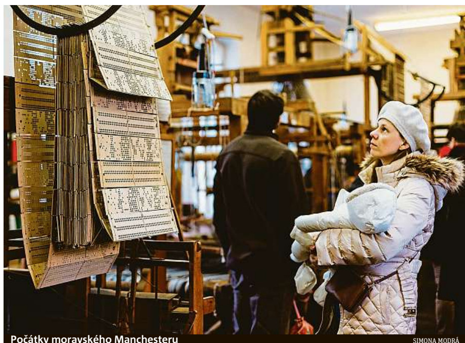
Počátky moravského Manchesteru