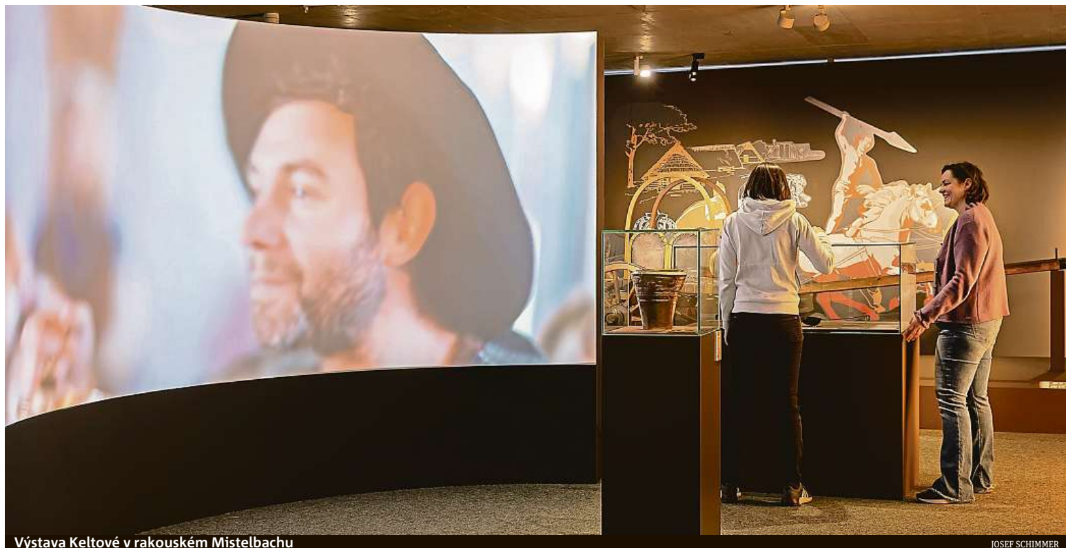
Výstava Keltové v rakouském Mistelbachu