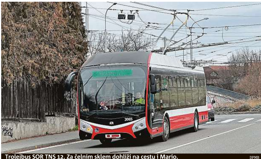
Trolejbus SOR TNS 12. Za čelním sklem dohlíží na cestu i Mario.

Brněnský dopravní podnik se rozhodl sestavovat si trolejbusy ve vlastních dílnách. První dva takové během března a dubna brázdí brněnské ulice v testovacím provozu. Pokud se osvědčí, dopravní podnik koupí ještě letos součástky na dalších deset vozů.