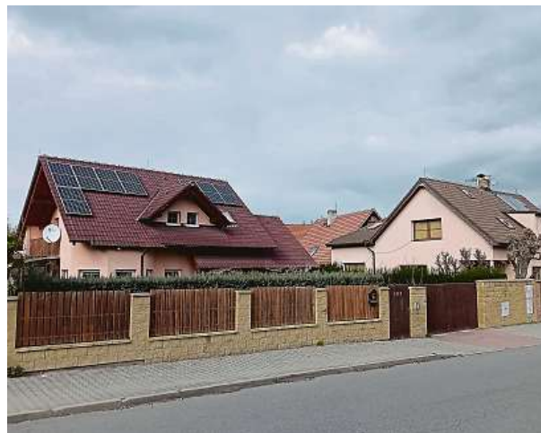
Na jih směřující střechy jsou ideální pro fotovoltaiku.

Odborníci také stále častěji doporučují přirozený způsob sušení prádla a oblečení na balkonech. Kvůli úspoře elektřiny. I když v minibusch novostaveb se leckde bez sušičky obejít nelze. PAVEL HRABICA