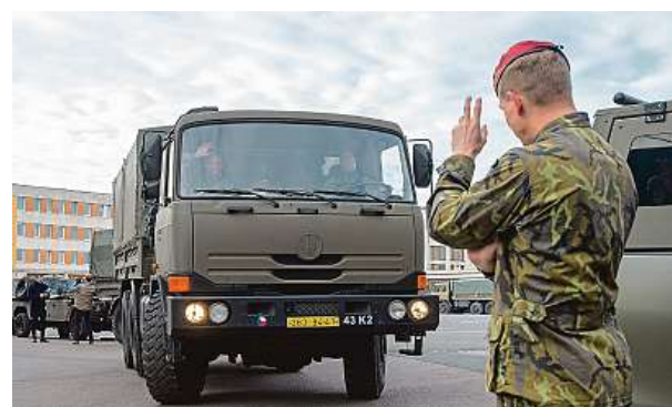
Včerejší příprava k odjezdu