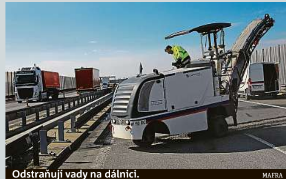
Odstraňují vady na dálnici.