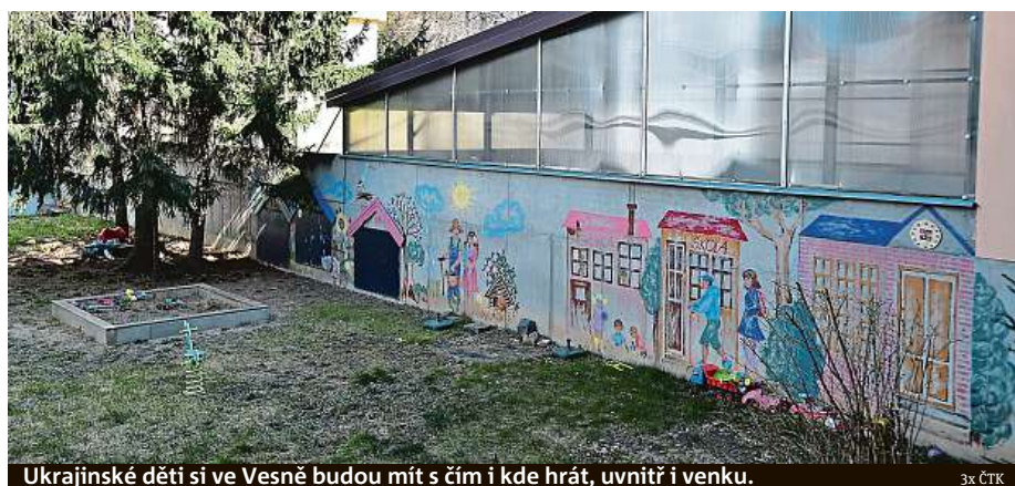
Ukrajinské děti si ve Vesně budou mít s čím i kde hrát, uvnitř i venku.