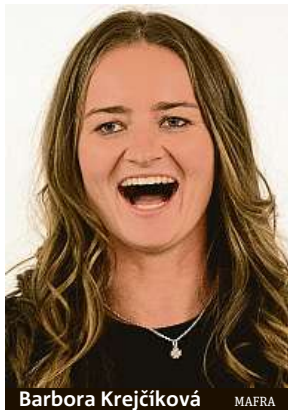
Barbora Krejčíková

Konec dosud suverénní Australanky Bartyové zamíchal s čelem ženského žebříčku.