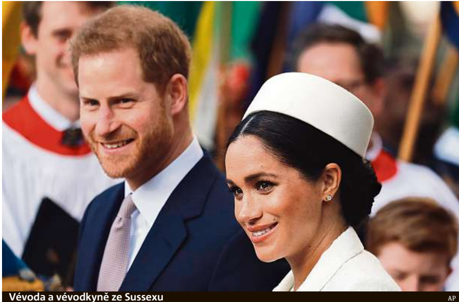
Vévoda a vévodkyně ze Sussexu

Dosavadním držitelem rekordu byl jihokorejský K-popový zpěvák Kang Daniel, který na dosažení milionu sledujících na Instagramu potřeboval dvakrát více času, přesně 11 hodin a 36 minut. Před Jihokorejcem byl držitelem re-