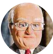
Bobo Dela Sogo Uklidím si svou pracovnu.