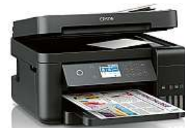
EPSON L6170 MIRONET

Mironet za 8330 korun. Jako bonus zde navíc zdarma získáte zásobu inkoustu až na tři roky (až 14 tisíc černobílých stran a až 11 tisíc stran barevně).