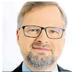
Petr Fiala, ODS

Požadavek ČSSD na odvolání poslanců SPD z vedení výborů a nahrazení jejich poslanci je politika koryt a falešných slibů.