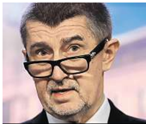
Andrej Babiš, ANO

Chápu, že vedení sociální demokracie chce vyjednat maximum. Rétorika ČSSD je ale pro mě nepřijatelná. Personální požadavky sociální demokracie na pět ministerstev a další místa ve Sněmovně jsou přes čáru.