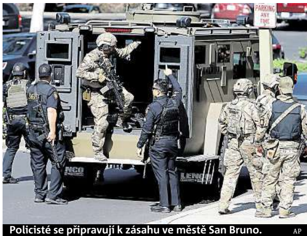
Policisté se připravují k zásahu ve městě San Bruno.