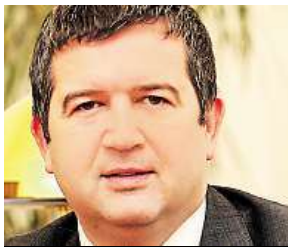
Jan Hamáček, ČSSD

Chápu, že vedení sociální demokracie chce vyjednat maximum. Rétorika ČSSD je ale pro mě nepřijatelná. Personální požadavky sociální demokracie na pět ministerstev a další místa ve Sněmovně jsou přes čáru.