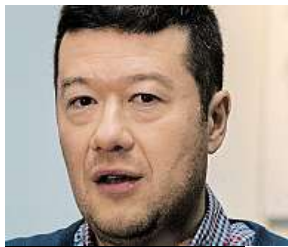
Tomio Okamura, SPD

Jednáme s odbory. Hlavní téma je jasné: znovuplácení nemocenské v prvních třech dnech nemoci, což je pro ČSSD jedna ze zásadních podmínek při vyjednávání s ANO. Řešíme i růst platů.