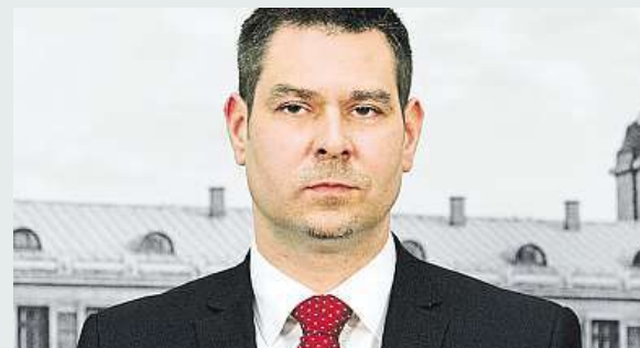
Cesko má nového ministra.