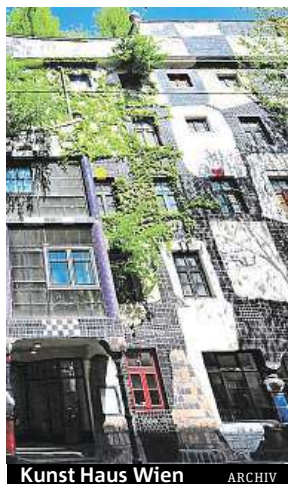
Kunst Haus Wien

Pokud už si budete chtít odpočinout od velkoměsta, tak se vydejte na procházku do zámecké zahrady Belveder, zahrady Augarten nebo do zámeckého parku Schönbrunn. LUCIE MOTTLOVÁ