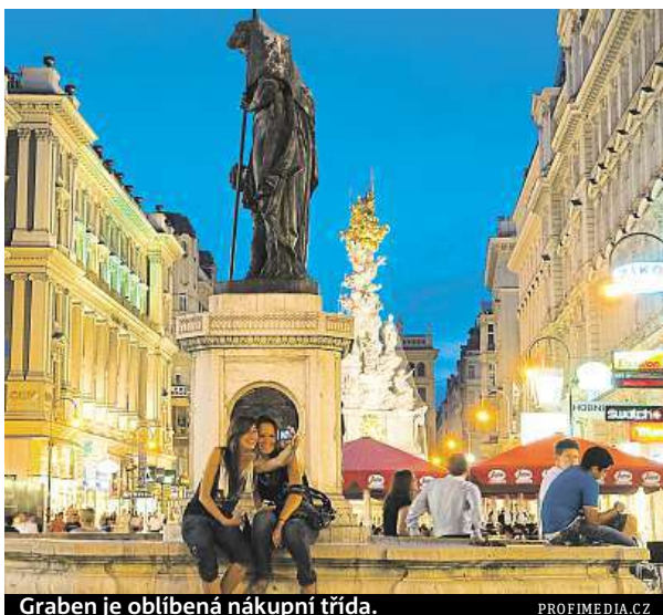
Graben je oblíbená nákupní třída.

Pro bohémy tu jsou stovky kaváren, ale také muzeí. V červnu nezapomeňte zajít na výstavu Od Moneta až po Picassa do Albertiny. Jestli dáváte přednost architektuře, pak byste se měli zastavit v Hundertwasserhaus od stejnojmenného architekta. Pítoreskní obytné domy trochu připomínají styl Antoního Gaudího. Najdete tu nákupní galerii a infocentrum. Když jdete stejnou ulicí podél kanálu, narazíte na Kunst Haus Wien, galerii současného