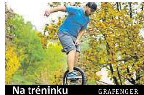
Na tréninku GRAPENGER

Dobrý den. Tyto úspěchy pro něho ale nejsou konečnou. Naopak jsou pro něj výzvou. Jak je