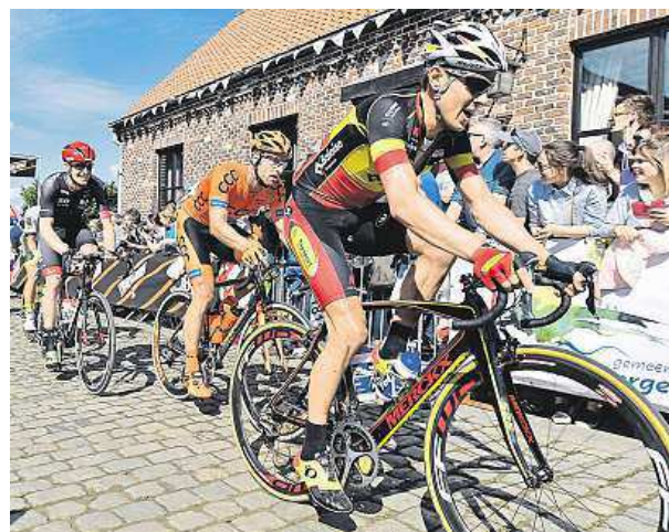
Fans are an important part of the race

Find these words in the grid: handlebar, saddle, pedal, helmet, track, pursuit, sprint, keirin, brakes, gears