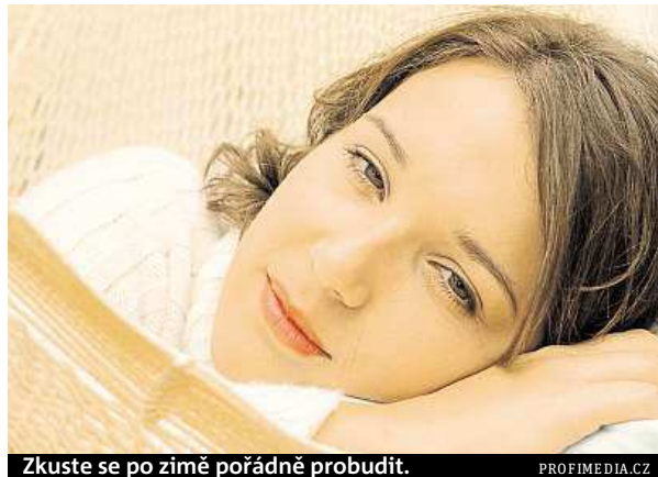
Zkuste se po zimě pořádně probudit.

Pokud tak už neděláte, naučte se ráno sprchovat. A na